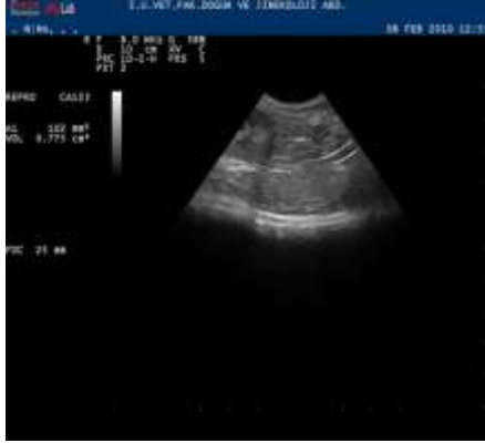
Şekil 2. Sol böbreğin hemen kaudalinde 8x10x7 mm ölçülerinde hipoekojenik ovaryum dokusu