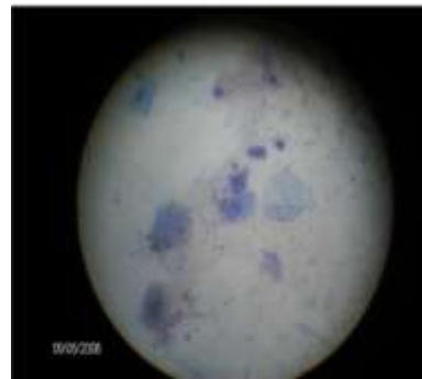
Şekil 1. Vaginal sitolojide izlenen kornifiye epitel ve nüklear süperfisiyal hücreler (10×40).

8 MHz'lik mikrokonveks prob transabdominal olarak uygulandığında idrar kesesinin hemen ventralinde lumen genişliği yaklaşık 3 mm olan, anekojenik kornu uteri tespit edildi. Sol böbreğin hemen kaudalinde ise 8x10x7 mm ölçülerinde hipoekojenik ovaryum saptandı ( Şekil 2 ).