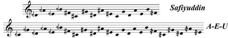
Şekil 2. Arel-Ezgi-Uzdilek ve Safiyuddin Dizilerinde Perdeler

uyandırarak büyük yaygınlık kazanmış olan on yedi perdeli sitem kullanılmıştır. Her iki sistemde de perdeler tam beşli zincirleriyle elde edilmektedir. Arel-Ezgi-Uzdilek dizisinde, on yedi sesli Safiyuddin dizisinde bulunmayan yedi yeni perde yer almaktadır. On yedi sesli Safiyuddin dizisini meydana getiren tam beşliler zincirinin yedi adım daha ileri götürülmesiyle elde edilen bu yedi perde aşağıda görülmektedir (Şekil 2).