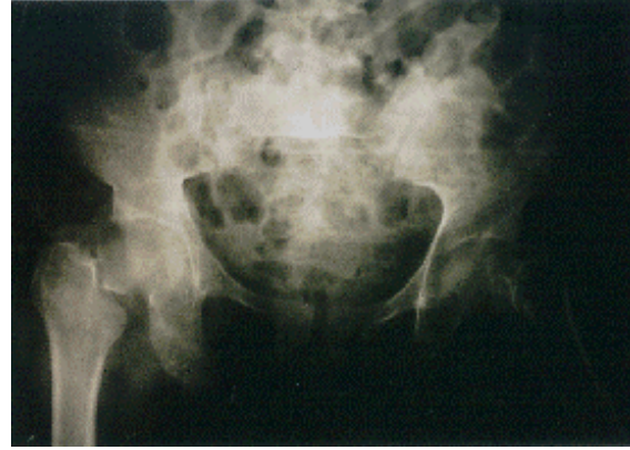
Resim 1. Hastanın preoperatif kalça grafisi

Kocher femur boynu kırıklarının büyük trokanter üzerine düşme veya ekstremitenin zorlu lateral rotasyonu ile olduğunu bildirmiştir (6). Bu ikinci mekanizmada baş asetabulum içinde kapsül ve iliofemoral bağ tarafından sıkıca tespitli iken femur