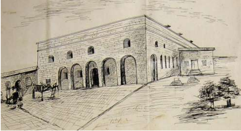
Resim Meryem Ana Kilisesi ve Yanındaki Okullar

19. yüzyılda Adıyaman'da Protestan Ermeniler dışında Gregoryen Ermenilere ait okullarında var olduğu görülmektedir. Nitekim 1874 yılında onlara ait olan Meryem Ana Kilisesinin inşaatı sırasında cemaatin eğitim alanındaki ihtiyaçları için kilisenin yanına iki adet küçük okul binası yaptırılmıştır. Bu okulların ihtiyaçları yerel halktan alınan yardımlar ve Adıyaman merkezdeki bir hanın geliriyle karşılanmıştır 57 . 1894 yılında Besni'deki Gregoryen cemaatin okulunun 40, Adıyaman'daki cemaatin ise kız ve erkek okullarında 72'si erkek olmak üzere toplamda 112 öğrencisi bulunmaktaydı 58 .