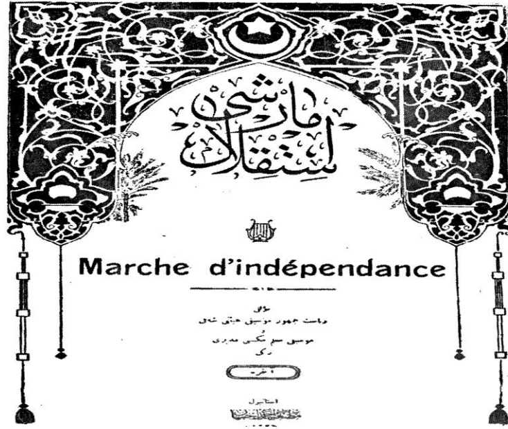
Millî marşımız "İstiklâl Marşı" nın ilk basımının kapak kompozisyonu