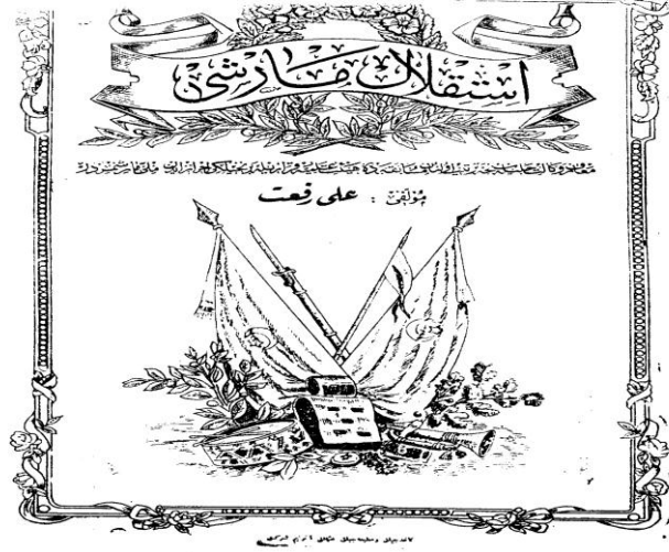
Ali Rifat Çağatay Bestesinin kapağı (1921)