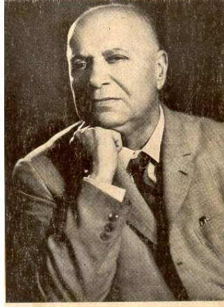
Şevket Süreyya Aydemir

Aydemir'in milli sol anlayışı süreçler içinde değerlendirilecek, Kemalizm'den Türk Sosyalizmi'ne söz konusu sol milli söylemin unsurları belirlenecektir. Sonuç bölümünde ise sol milli söylemin unsurları, koşullardan bağımsız bir biçimde genel hatlarıyla belirlenecektir.