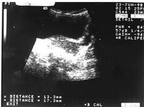
Şekil 3. Medikal tedaviden altı ay sonra ultrasonografide tamamen normale dönen over ve tubular görülmektedir

Tüm kan biyokimyası ve tümör markırları ( \alpha -FP, \beta -HCG, CEA, LDH, Ca-19, Ca-125) yapıldı. Sedimentasyon hızının ve tümör markırlarından Ca-125 yüksek olması dışında laboratuvar tetkiklerinde bir özellik saptanmadı. Akciğer grafisi normaldi. Parasentez sıvısı açık sarı renkli olup eksüda karakterinde, protein ve lenfositten zengin bulundu, ancak yaymada aside drençli basiller görülmedi ve kültürde üreme olmadı. PPD'si pozitif olan hastaya İsoniazid (INH) + Rifampin (RIF) + Pyrazinamide (PZA)'den oluşan üçlü antitüberküloz tedavi başlandı, iki ay sonra INH ve RIF'le devam edildi (INH 5mg/kg/gün, RIF 10mg/kg/gün, PZA 15mg/kg/gün). Tedaviden bir ay sonra klinik bulgular, üç ay sonra da radyolojik bulgular tamamen düzeldi (Şekil 3). Medikal tedavi 6 ay devam edilen hasta, 6 ayda bir klinik ve ultrasonografik değerlendirilmeye alındı. Hastamız halen yakınmasız ve bir yıldır nüks görülmemiştir.