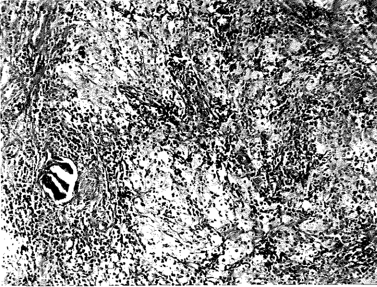
Resim 2. Glomerül ve interstisyumda lipidle yüklü histiyositlerden baskın iltihapsal infiltrasyon (H.Ex 125).

sıklıkla izole edilen mikroorganizmalar E.coli ve Proteus mirabilis 'tir (2,6). Hastamızın yapılan tetkiklerinde böbrek taşına ve üriner enfeksiyonuna rastlanmadı. Tanısal amaçla intravenöz piyelografi (İVP), ultrason ve BT en sık kullanılan radyolojik tetkikler olmasına rağmen BT, tamda en yararlı tetkiktir. Lezyon BT'de tipik olarak obstrüksiyon yaratan taşın üzerinde hafifçe yükselen bir kitle şeklinde görülür (6). Ek olarak böbrek taşı, renal volum artışı, hidronefroz ve ekstrarenal yayılım diğer BT bulgularıdır. Hastamızın yapılan ultrason ve BT bulguları ise renal tümör ile uyumlu kitleyi gösteriyordu.