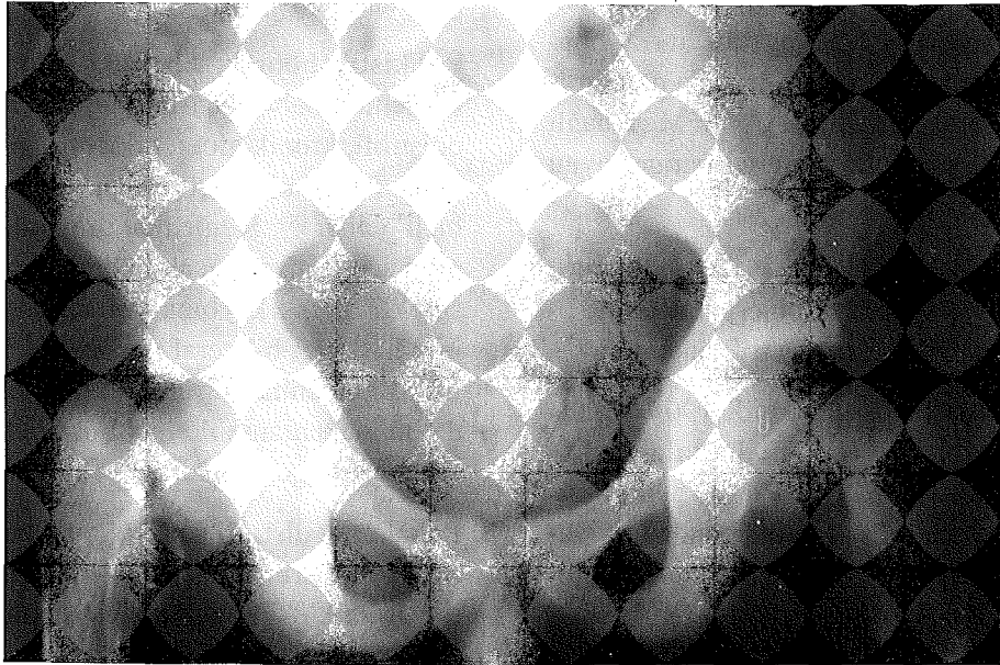
Resim 1. Pelvis grafisinde bilateral femur boynu kırığı

Klinik gidiş ve tedavi: Hastaya intravenöz bikarbonat ve dil altı nifedipin verildi. Serum Ca'u düşük olduğundan 3 kez I.V. 10 cc kalsiyum glukonat uygulandı. Dihidroksikolekalsiferol (calcitriol) tedavisi başlandı. Yatışının 2. gününde 2 kez jeneralize tonik klonik konvulsiyonu oldu. Serum Ca'u bu sırada 5.5 mg/dl tespit edildiği için konvulsiyonlar hipokalsemiye bağlandı. Böbrek yetersizliği nedeniyle hemodiyalize alındı. Diyaliz sırasında konvulsiyonu 2 kez daha tekrarladı ve hasta lüminalize edildi. Bilinci açıldıktan sonra ciddi bacak ağrısı ve hareket kısıtlılığı olan hastanın grafisinde bilateral femur boynu kırığı tespit edildi (Resim 1). Önce traksiyona alındı. Ortopedi ve Travmatoloji kliniğinde bir hafta ara ile her iki femur boynuna Intertrokanterik Pauwels Osteotomisi uygulanarak platin plak yerleştirildi (Resim 2). İlk operasyondan hemen sonra serum Ca'u yükseldiği için IV Ca kesildi ve oral CaCO 3 ve calcitriol tedavisine devam edildi. Hemo-