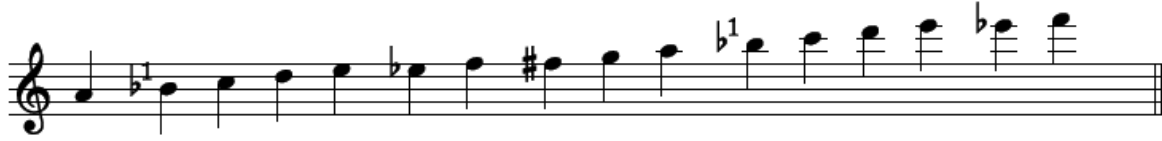
Şekil.8 “Gine Göç Eyledi Avşar Elleri” isimli bozlağın dizisi

Geleneksel icralarda sıklıkla yer alan ‘RE’ sesi (4. Derece) üzerine kurulan ‘Garip Geçkisi’ nin sadece bağlama çalgısı ile icralarda yer aldığı, eserin zenginleştirilmesi için icra edilebileceği, bununla beraber bozlağın söz bölümünde icra edilmemesi gerektiği belirtilir. Seslendirme sırasında koma (çeyrek) seslerin bozlağın karakterini yansıtabilmek açısından doğru icrasının önemine dikkat çekilir. Verilen bilgilerin öğrenci tarafından tekrar edilmesi istenir. Bozlağın dizisi nota halinde verilir. Bağlama ile bozlağın dizisi icra edilerek örneklendirilir.