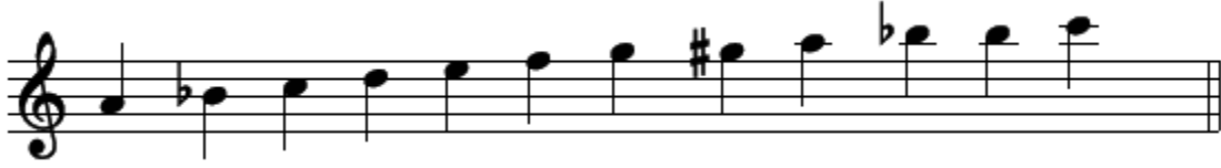
Şekil 3. ‘Sarı Yazma Yakışmaz mı Güzele’ isimli bozlağın dizisi

icrasının önemine dikkat çekilir. Verilen bilgilerin öğrenci tarafından tekrar edilmesi istenir. Bozlağın dizisi nota halinde verilir. Bağlama ile bozlağın dizisi icra edilerek örneklendirilir.