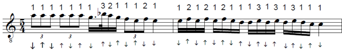
Şekil.4 “Sarı Yazma Yakışmaz mı Güzele” bozlağının icrasına yönelik 1. alıştırma

*Alıştırma 1, eserin girişinde yer alan üçlemelerin ve 5.6. dereceler ve 4.5. dereceler arasında çarpmalar icra edilerek sonrasında 3. Derece do sesini (asma karar) duyurmaya yöneliktir.