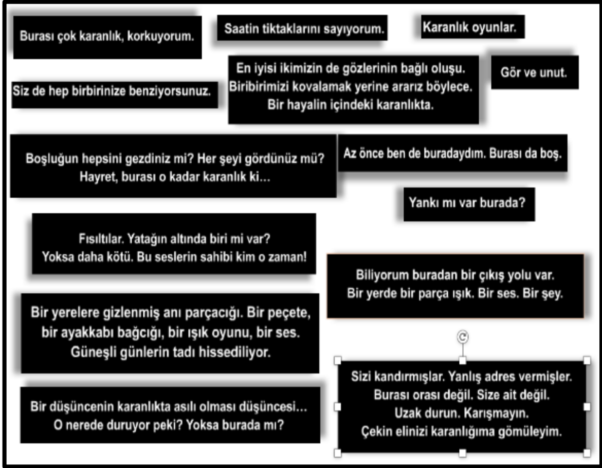
Görsel 4. İçboşluk isimli etkileşimli dijital anlatıdan ekran resimleri.

Deneyimleyen başlangıçta tüm bunlara bir anlam veremez çünkü İçboşluk 'un ona bir şey anlatmak gibi bir amacı yoktur. İçboşluk fısıltılardan oluşan derin bir karanlık, deneyimleyenin iç boşluğunda bir yoğunlaşma, kulağı parçalayan sessiz bir çığlık gibidir. Bu deneyim deneyimleyenin kendi karanlığında oynadığı körebe oyunu gibidir. Deneyimleyen kendi iç boşluğunun karanlığında dokunduğu nesnelere anlam vermeye çalışır. Karşılaştığı kapıların ardında bulunan sözceleri kendi bilincinin kavram okyanusundakiler ile eşleştirmeye çalışır. Kendi karanlığında, kendi iç boşluğunda yaşamının belirli dönemlerinde kapattığı kapıları açmaya çalışır. Bu denemelerde geçmiş, deneyimleyenin kulaklarında yankılanır ve anı kurgulayan kırıntılara dönüşür. An elini geleceğe uzatır. Zaman şimdinin sonsuz karanlığında yoğunlaşır.