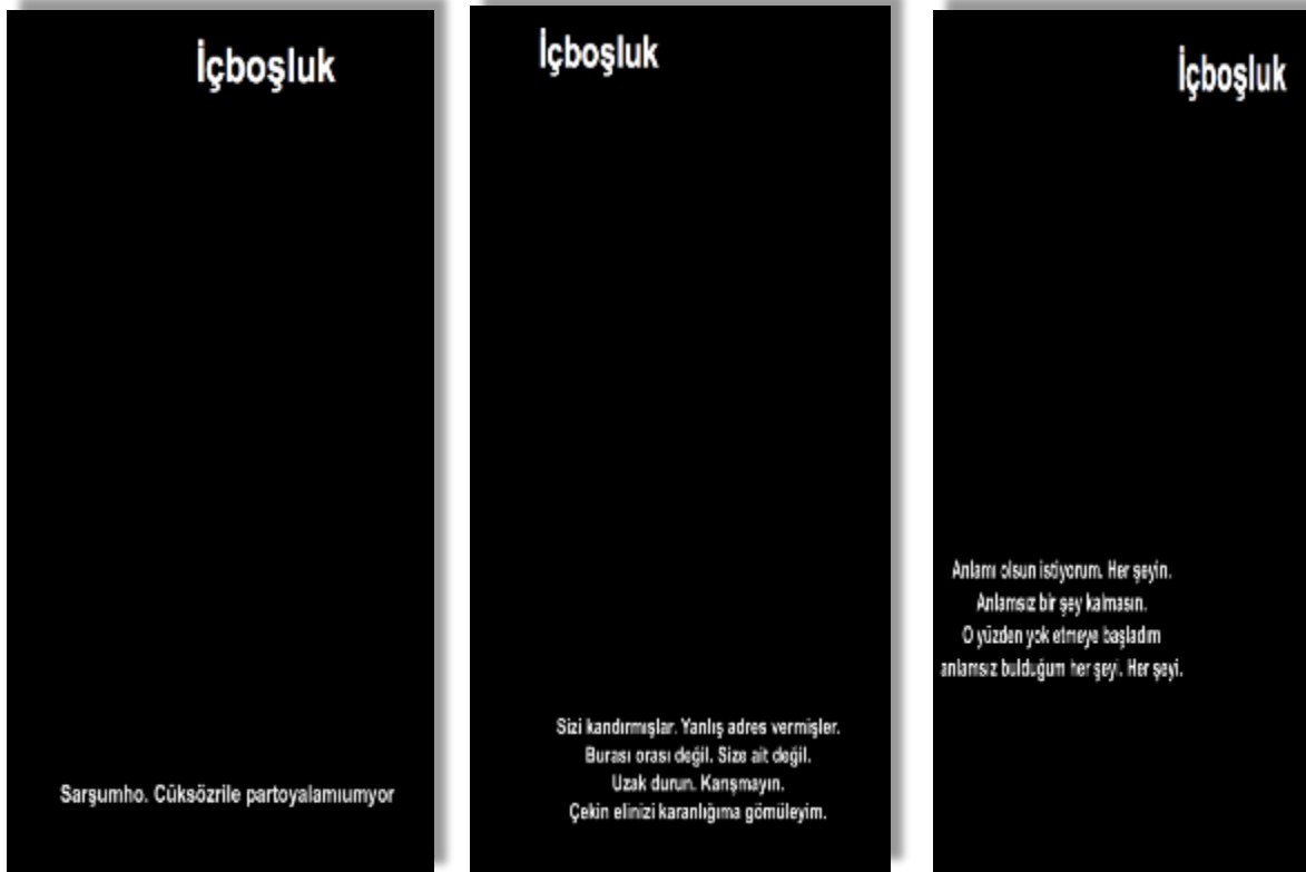
Görsel 2. İçboşluk isimli etkileşimli dijital anlatıdan ekran resimleri.

İçboşluk deneyimi anında deneyimleyen elinde üzerinde gösteren gösterilen ilişkisi kurabileceği sabit bir anlatı da yoktur. Her şey siyah bir ekran üzerinde açılan sonsuz bir iç boşluktan ibarettir. Söz konusu siyah ekran üzerinde beliren gösterenlere, anlatsal makroyapıya ait programın sunduğu kesinlik ve deneyimleyen tarafından anın bağlamsallığında üretilen rastlantısallık arasındaki ilişki aracılığı ile erişilir.