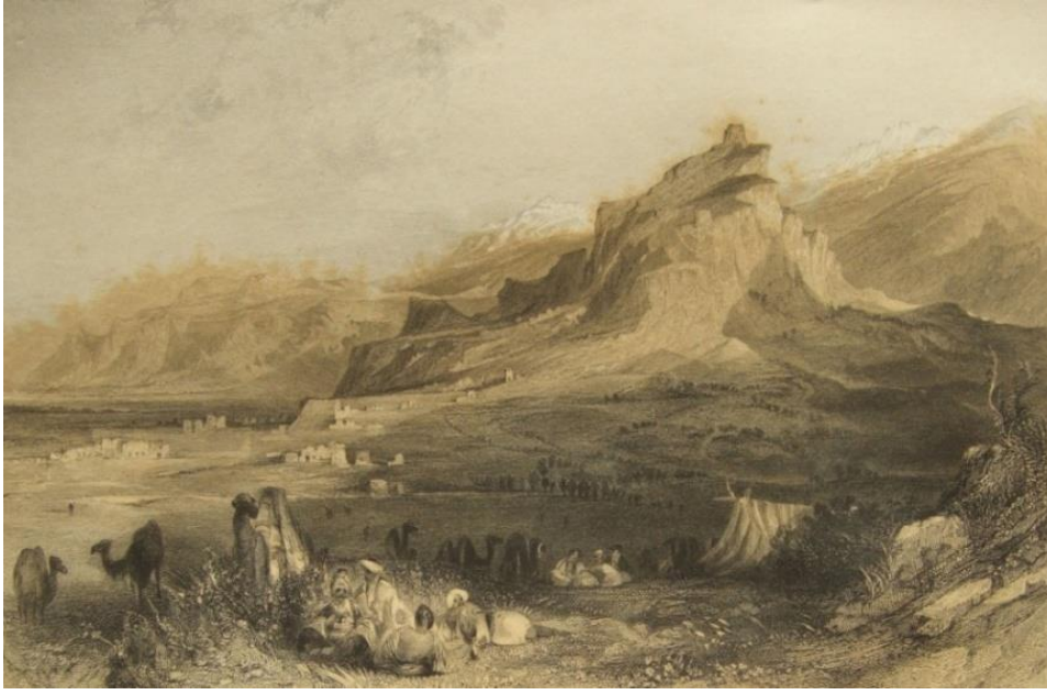
Foto. 5. Manisa- Salihli- Sardes Harabeleri