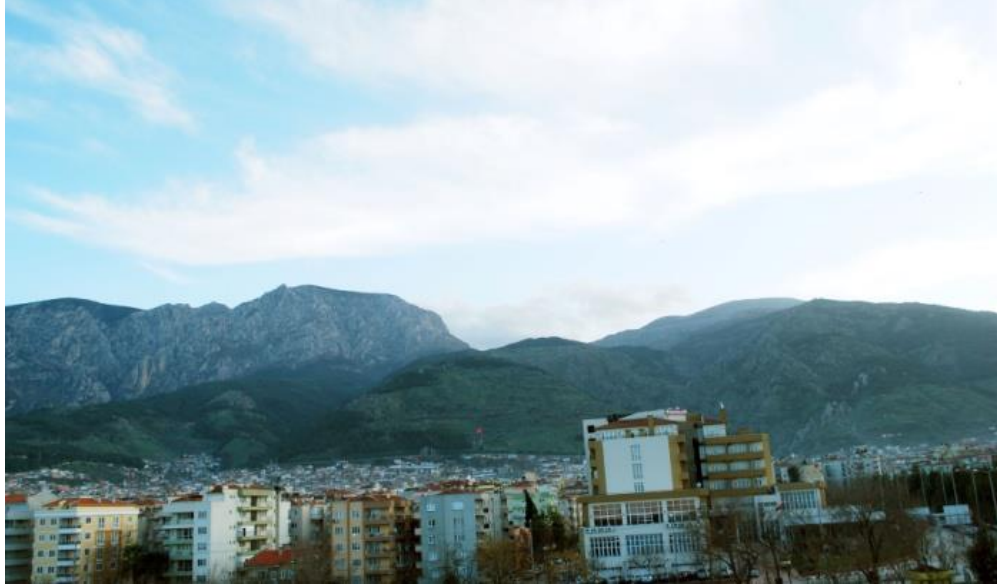
Foto. 11. Manisa, Genel Görünüm

Osmanlı-Müslüman karakteri gözler önüne serilmiştir (Foto.1). Gravürdeki kent, doğal olarak, şehrin bugünkü halinden hayli farklıdır. Dünü ve bugününde değişmeyen tek şey ise Sipil Dağı'nın hâkimiyetidir (Foto.11).