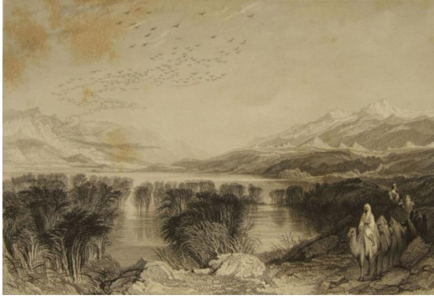
Foto. 6. Manisa- Salihli- Marmara Gölü ve Bintepeler Kral Mezarları

Walsh'un eserinde yer alan ve Allom imzalı, Manisa- Salihli-Marmara Gölü ve Bintepeler Kral Mezarları isimli gravürde, göl ve mezarlar bir arada verilmiştir (Foto.6). Kompozisyonun ön planında, sazlıklarla kaplı gölün kenarından ilerleyen bir kervan resmedilmiştir. Issız bir atmosfere sahip resimdeki hareket, kervanın geçişi ve havada süzülen kuşlarla sağlanmıştır. Ayrıca, durgun su üzerine sazlıkların gölgeleri düşürülerek kompozisyona canlılık katılmıştır. Resmin geri planını tümölüsler ile ıssız dağ sıraları oluşturmaktadır. Daha çok bölgenin tanıtımı amacıyla yapılan gravüre ıssızlığı bozacak şekilde kervan geçişinin dâhil edilmesi ve genel betimleme anlayışı, Oryantalist üslubun etkileridir.