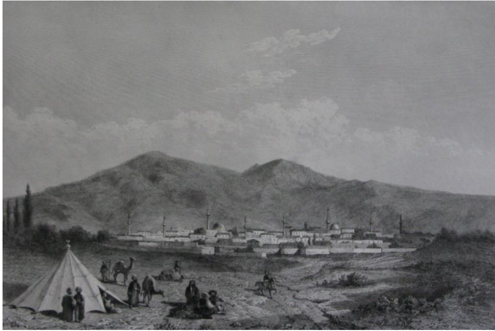
Foto. 3. Manisa- Kula

Kompozisyonun ön kısmında, çadırlarını kurarak dinlenen bir kervana yer verilmiştir. İki deveci develeri ile yürümekte, çadırın arkasında iki erkek sohbet ederken ortada üçlü bir figür grubu bulunmaktadır. Erkeklerden biri çubuğunu içmekte, diğer ikisi sohbet etmekte, biraz geride de atlı bir figür bir patikada ilerlemektedir. Arka planda, surlar içerisinde ev ve camileri ile Kula görülür. Yapıların ayrıntıya girilmeden genel hatlarıyla verildiği bu görüntüde minarelerin vurgulanması, kentin Osmanlı İslâm kimliğine vurgu yapmaktadır. Kompozisyon, geride yükselen ıssız ve yalçın dağ sıraları ile son bulmaktadır.