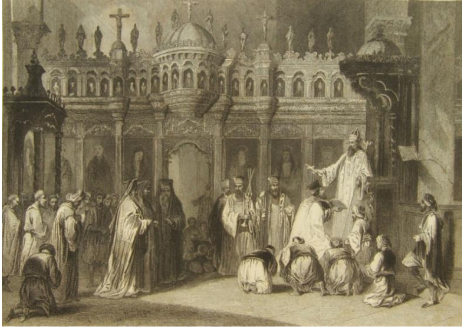
Foto. 9. Manisa Kilisesi