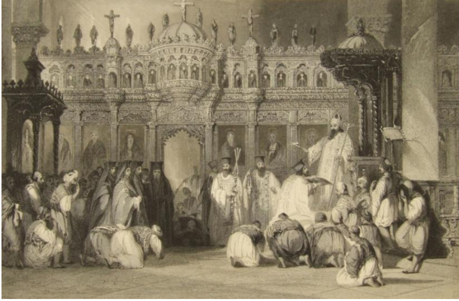
Foto. 8. Manisa Metropolitan Kilisesi

Gravürün ön kısmında, ambon denilen vaaz kürsüsünde bir din adamı, elinde bir haç tutarak önündeki dinî görevliyi kutsamaktadır. Din adamları ile inançlıların oluşturduğu kalabalık grup, ayini heyecanlı ve saygılı bir biçimde izlemektedir. İkonastasis duvarı ikonalarla bezelidir.