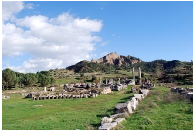
Foto. 13. Manisa, Salihli, Sardes Harabeleri, Artemis Tapınağı

Gravürde ıssız bir atmosferde verilen antik kentin zengin geçmişinde, Pers, Roma ve Bizans yönetiminde parlak dönemler yaşamış bir kent olduğuna inanmak güçtür. Susa'dan başlayıp tüm Anadolu'yu geçen Kral Yolu'nun son noktası olan bu antik kent günümüzde ne yazık ki Sart Mahmut Köyü içine sıkışmış vaziyette yalnızlığa gömülmüştür. Tarihin bu parlak kenti şimdilerde unutulmaya yüz tutmuştur. Antik kentte yapılan başarılı arkeolojik çalışmalar sayesinde ayağa kaldırılan eserler, sevindirici olan tek yöndür. 1910-14 yıllarında başlayan ve günümüzde de devam eden arkeolojik kazı ve restorasyon çalışmalarında, Roma Dönemi'ne ait M.Ö. 211 tarihli iki katlı devasa gymnasium ile M.Ö. 220-221 tarihli sinagog ve M.Ö.300'lerde inşa edilmiş olan Artemis Tapınağı ayağa kaldırılmıştır. Kent, günümüzde, gravürde görülen halinden daha iyi bir durumdadır (Foto.13).