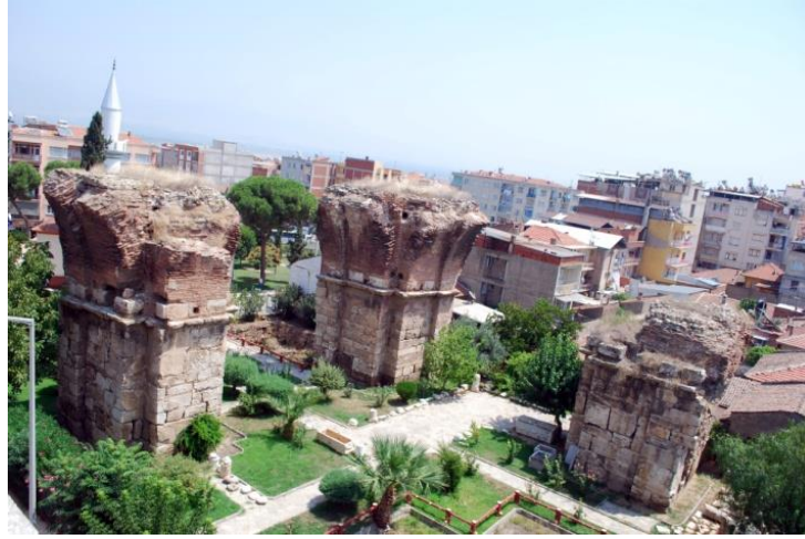
Foto. 12. Manisa, Alayehir, Yedi Kilise'den Biri Olan St. Jean Kilisesi

Diğer ilgi çeken yerleşimden Sart (Sardes), yedi kiliseden birini barındırmasının yanında Lidya uygarlığının başkenti olması açısından da seyahatnamelerin konuları arasına girmiştir. Walsh'un eserinde yer alan Allom imzalı Manisa-Salihli-Sardes Harabeleri adlı gravürde, Oryantalist bir etki ile uçsuz bucaksız ve çorak bir arazi üzerinde konaklayan kervan ve antik dönem kalıntıları belli belirsiz şekilde verilmiştir (Foto.5). Gravürde vurgu Sart harabelerinden çok Doğu yaşamı üzerine çekilmiştir. Burada Batılı'nın gözündeki Doğu insanı canlandırılmış; rehavet içinde, yerlerde dinlenen figürlerle imgeleştirilmiştir.