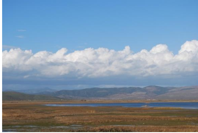
Foto. 14. Manisa, Salihli, Marmara Gölü ve Bintepeler Kral Mezarları

Manisa'yı ziyaret eden gezginlerin özellikle üzerinde durdukları konulardan biri, Salihli'nin kuzeyindeki Marmara Gölü (Gygaia) ve gölün güneyinde, Gediz (Hermos) ovasının kenarında bulunan tümülüs şeklinde Lidya Kral Mezarlığı (Bintepeler)'dir. Göl ve mezarların bir arada bulunduğu çalışma Walsh'un eserinde yer alan ve Allom imzalı, Marmara Gölü ve Bintepeler Kral Mezarları isimli gravürdür (Foto.6). Bugünkü hali de gravürdeki ıssız görüntüden farklı değildir. (Foto.14).