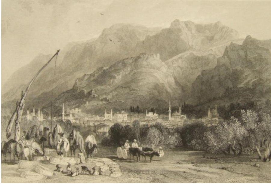
Foto. 2. Manisa ve Sipil Dağı