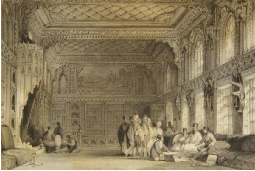
Foto. 10. Manisa- Alaşehir- Philadelphia- Hükümet Konağı

yabancıdır. Divanda oturan üç figürden elindeki çubuğu tuttüren ortadaki, muhtemelen kentin üst düzey bir yöneticisidir ve önünde çömelerek bazı kâğıtlar açmakta olan bir Avrupalıyı dikkatle dinlemektedir. Ayakta duran diğer grup da olayı aynı merakla izlemektedir. Mekânın karşı arka köşesinde üçlü bir figür grubuna yer verilmiştir, daha önde ise, ocağın hemen yanında sahibini bekleyen bir nargile görülmektedir. Sanatçının zengin ahşap işçiliği ile bezeli bu mekânı tüm ayrıntılarıyla yansıtmış olması, büyük bir gözlem ve emeğin ürünüdür.