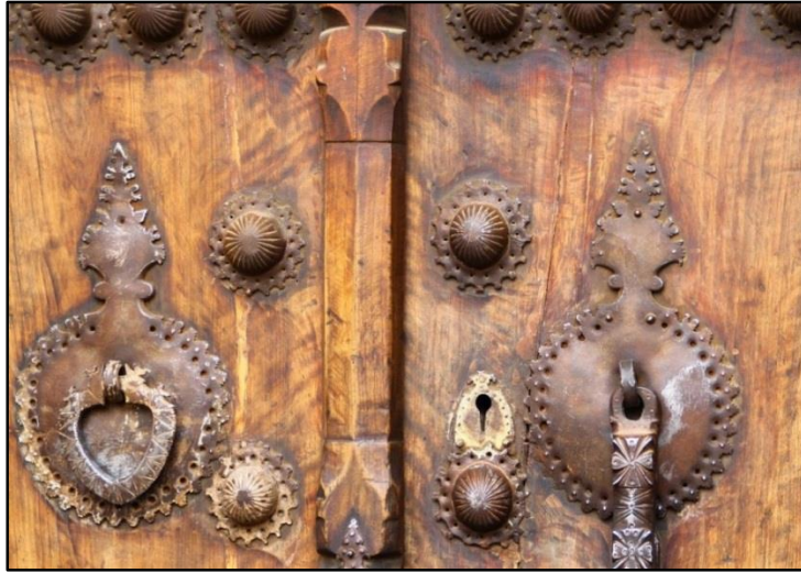
Fotoğraf 3: Geleneksel Kemaliye Evi Kapı Tokmakları

Kemaliye konutlarının en önemli geleneksel motifi kapı tokmaklarıdır. Dönemin demirci ustaları tarafından üretilen kapı tokmakları ve bu tokmalardan elde edilen sesler ilçenin tarihini ve kültürünü yansıtmaktadır. Geleneksel konutların göz alıcı ahşap yapısı ve bu ahşap yapıda dikkat çeken kapı tokmakları ziyaretçiler tarafından büyük ilgi görmektedir.