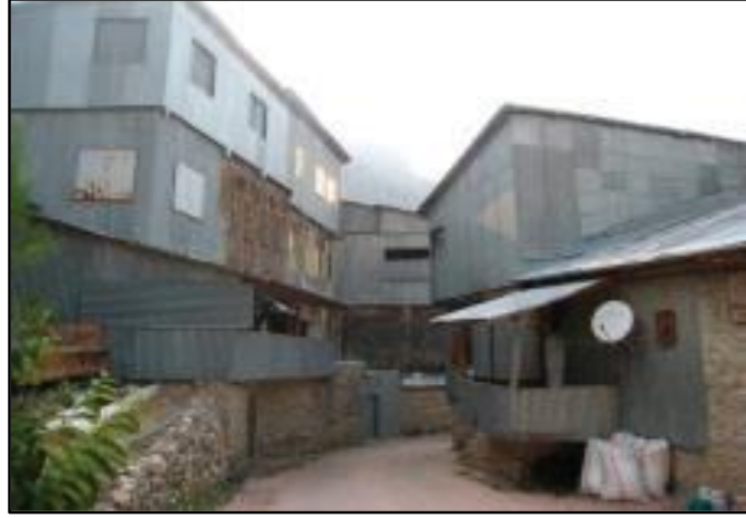
Fotoğraf 5: Evlerin Çatı ve Cepyelerinin Sac Malzemeyle Kaplanması

Bir diğer yöntem ise mimari dokuyu olumsuz etkileyen sert kış şartlarını önlemek amaçlı ortaya çıkmıştır. Kemaliye’de bulunan geleneksel konutlar halk tarafından daha çok yazlık ev gibi kullanılmaktadır. Bu durum da zaten hassas bir hale gelen mimari doku için tehlike arz etmektedir. Bu nedenle bölge halkı tarafından kendi çabaları ile birtakım koruma çalışmaları yapılmaktadır. Yerel ustalar tarafından yapılan sac kaplama uygulaması ile konutlar korunmaya çalışılmaktadır. Ancak bu işlem mimari dokuya zarar vermiş ve bir görüntü kirliliğine sebep olmuştur (Korkmaz ve Akdemir, 2015: 498). Bu durum sit alanı ilan edilen ve kültürel miras niteliği taşıyan yapılara ev sahipliği yapan bir ilçe açısından oldukça kötü bir manzara olup, yerel yönetimler tarafından gerekli denetimlerin yapılmadığını göstermektedir. Bu değerlerin korunmasına yönelik yapılan uygulamalar yapının karakterinin bozulmasını önleyen değişim ve uyum çabalarını kapsayıcı olmalıdır (Gökgür ve K.Altay, 2017: 294). Genellikle bölge halkı maddi sebepler dolayısıyla bu tarz girişimler gerçekleştiriyorsa, bunların da yine ilgili kamu kurumları tarafından desteklenip, aslına uygun bir şekilde korunma çalışmalarının yapılması gerekmektedir. Aksi takdirde yapıyı korumak adına özgün mimarinin bozulmasına ve turistlerin bölgeyi zaman içerisinde terk etmesine sebep olabilir.