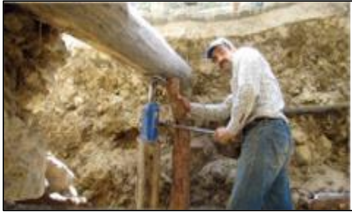
Fotoğraf 4: Emanete alma