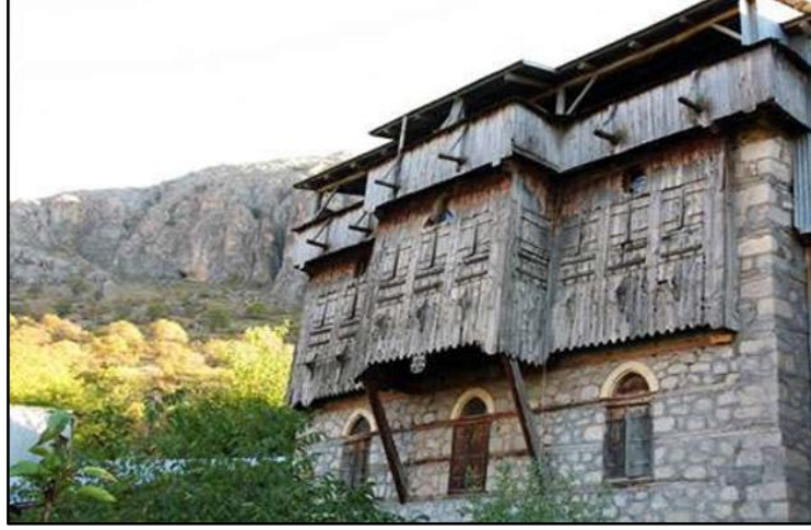
Fotoğraf 2: Geleneksel Kemaliye Evi

mimarisinden izler taşımaktadır. Evlerde taş malzeme yoğun kullanılmış ve ahşap ile taş malzeme uyumlu bir şekilde inşa edilmiştir (Alper, 1990: 74).