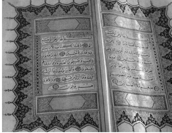
2 Tezhipli bir Kur'an-ı Kerim'in serlevhası

Cilt, yazılı ve basılı eserlerin dağılmadan saklanması ve yapraklarının yıpranmaması için yapılan koruyucu sert kapaktır. Arapça kökenli bir sözcük olan kitap cildinin dilimizdeki karşılığı kap, kitap ve meşin koruyucuyla eş anlamlıdır (Taviloğlu, Temeller ve Ülker, 2007). Klâsik Osmanlı el yazması ciltleri toplam dört ana bölümden oluşmaktadır: Alt ve üst kapak, sırt, sertab ve mikleb. Alt ve üst kapak, kitap yapraklarını içine alan örtüdür. Sırt, yaprakların bağlandığı şirazenin dış kaplaması ya da yazmanın dip kısmıdır. Sertab, kapakla mikleb arasında yazmanın açılan yüzünü kapatan bölümdür. Mikleb ise sertabın ucunda genellikle üç köşeli olup, yazma örtüldüğünde kapak altına sokulan ve yazmanın bütünüyle örtülmesini sağlayan kısımdır (1).