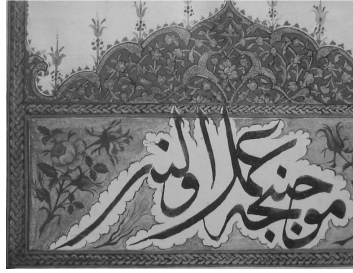
5 Mihrap içine çekilmiş hattı-hümayun

XVI. yüzyıla kadar tuğra alanı içine işlenen sade çiçek motifleri, bu dönemden sonra gül, karanfil, lale, nergis ve sümbül gibi belirgin çiçeklere dönüşmüş, çiçek ve çiçek buketleri şeklinde tuğra alanın dışına işlenmiştir. Bu yeni tarz XVI. yüzyıldan sonra çıkarılan çoğu fermana görülebilmektedir.