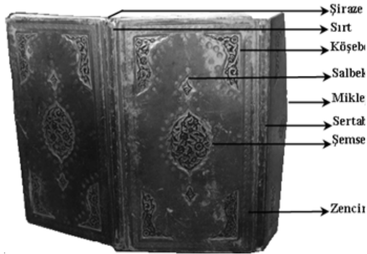
1 Klâsik bir Osmanlı cildinin bölümleri

İmparatorluğun çeşitli dönemlerinde yapılabildiği günümüz kütüphane ve müzelerinde muhafaza edilen ciltlerin, fildişi oymalı, mozayık tezyinatlı, kabartma süslemeli, altın kaplamalı, yakut, zümrüt, inci ve elmas gibi değerli malzemelerle bezendiği görülmektedir. Genellikle bu tür malzemelerin kullanıldığı yazma eserler devrinin önde gelenleri ya da zenginleri için yazılmıştır (Çığ, 1953: 16). Divan ve padişahlara sunulan el yazmaları yoğun bir tezhipte işlenmiştir. Özellikle süsleme unsurları bu tür yazmaların zahriye 4 ve serlevha 5 sayfalarında daha fazla görülür (Türk, 2007). Bunun dışında eser içlerinde minyatür ve ciltlerin kapaklarında ise ebrulu kâğıt kullanımı çok yaygındır.