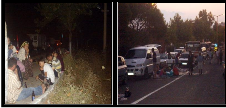
Fotoğraf 5. Milli parkın giriş kapısındaki ziyaretçi ve araç kuyruğundan bir görünüm

Bu koylar, yalnız yakın çevreden gelenlerle değil, İzmir ve Aydın gibi şehirlerden gelen ziyaretçilerle, turizm sezonunda, özellikle hafta sonları aşırı yoğunluk yaşar. İnsanlar bu koyların temiz denizinde yüzmek ve ağaçların altında piknik yapıp, dinlenmek için sabahın erken saatlerinde yollara dökülüp milli parkın giriş kapısında araba kuyruklarının oluşmasına neden olurlar (Fotoğraf 5).