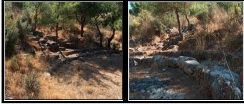
Fotoğraf 2. Kutsal Panionion kenti kalıntılarının farklı açılardan görünümü

Tarihin babası olarak bilinen Herodot, bu yöre için şu sözleri söylemiştir; Güneşle denizin, tarihle doğanın birleştiği, yeryüzünün üstünün, gökyüzünün altının en güzel yeri: Panionion (Güzelçamlı) 'dur (George, 1997: 196-198).