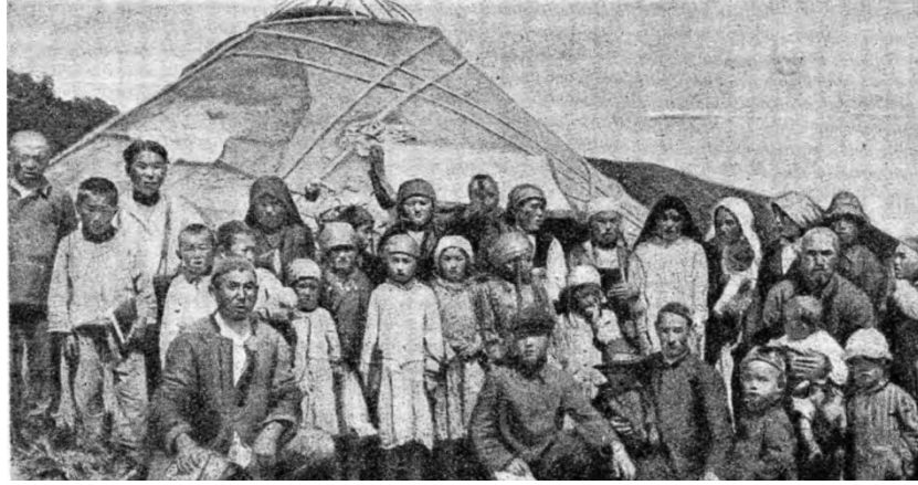
Resim 2: Okur yazarlığı yaygınlaştırmak amacıyla kurulan geçici eğitim veren çadır okul önündeki Sart Kalmaklar, Zindan ayılı, 1929. (Burdukov 1935: 65)

Kara Kalmak olarak kendini adlandıran bu grubun Sart Kalmak şeklinde etnik ad almasının, 19. yüzyılda Karakol bölgesine yerleştikleri süreçte gerçekleştiği, o zamanlardaki Rusça belgelerde Kara-Kalmak olarak kaydedildikleri (Cukovskiy 1980: 157), Kırgız ve Özbeklerle birlikte yaşamlarını devam ettiren Kara Kalmaklara 1900'lü yıllardan, bilhassa da 1924 yılında Orta Asya'daki sınırların çizilmesi çalışmalarından itibaren Sart Kalmak denilmeye başlandığı ile ilgili bilgiler de mevcuttur (Abaşın 2004: 6-38).