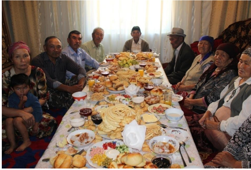
Resim 3: Çelpek ayılındaki Sart Kalmaklar, 2012.

Verniy (Alma Ata) bu idarî bölgenin merkezi idi. Sart Kalmaklar'ın başında bulunan Momun ata ve Kerem Abday Uulu Verniy'da bulunan Yedisu valisi ile görüşür. Vali, onların bölgeye yerleşmelerine olumlu bakar. Monun Ata ve Kerem Abday Uulu valinin verdiği resmî yazıyı Karakol'daki Çarlık yetkilisine getirirler. Bunun neticesinde Sart Kalmaklar başta Çelpek olmak üzere bugün yaşadıkları köylere yerleşirler. Bölgeye yaklaşık 150 tütün yani ailenin yerleştiği belirtilir (Mansurov 2004: 7-8). Bu da o dönemde buraya göç edenlerin yaklaşık olarak 600 ile 750 kişi olduğunu gösterir ki bu sayının doğru olduğu söylenemez. Sözlü kaynaklara göre 1882 yılında bölgeye yerleşenlerin sayısı 1048 kişidir. Bölgede yapılan 1917 tarihli ilk resmî kayıtlara göre Sart Kalmakların sayısı 2405, 1929 yılında yapılan kayıtlarda ise 3588 kişidir (Burdukov 1935: 68). Sart Kalmaklar'ın günümüzdeki sayıları 10-12 bin civarındadır.