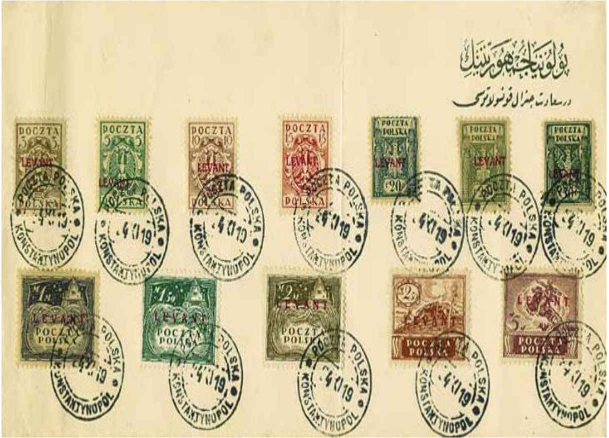
Polonya Cumhuriyeti İstanbul General Konsolosluğu ve Levant İşaretli Pullara Dair Bir Belge ( http://www.stampspoland.nl/index.html )