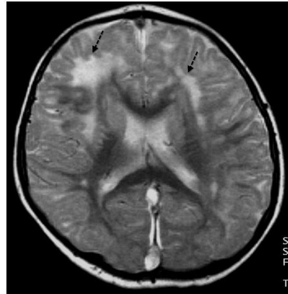
Resim 3: T2A MR imajda frontal ve paryetal loblarda subkortikal ak maddede hiper intens (ok) patolojik sinyal değişiklikleri izlenmekte

Serebral Venöz Tromboz ilk klinik tanımlamasını Ribes'in 1825 yılında yapmasıyla birlikte fatal ve çoğu zaman postmortem tanı konulabilen klinik bir bozukluk olarak tanımlanmıştır (8). En çok etkilenen sinusler %72 süperior sagittal sinus ve %70 lateral sinuslerdir. Olguların 1/3'ünden fazlasında birden fazla sinus, %30-40 ise hem sinusler hem de serebral ve serebellar venler tutulur. Serebral venöz sistem içindeki yoğun kollateral dolaşım nedeniyle trombus oluşumunun erken dönemlerinde belirti ortaya çıkmayabilir (9,10).