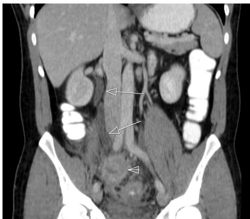
Resim-1: Üreteral dilatasyon.

minimal sıvı, distal ileal ansta lezyon alanına doğru hafif retraksiyon, terminal ileum cidarında diffüz tarzda duvar kalınlaşması izlenmiştir (Resim 1). Batın eksplorasyonu öncesi tespit edilen kitlesinden iğne biyopsisi alındı, patoloji raporunda "Dokulardan biri sadece iltihabi infiltrasyon içermekte olup dokunun bir ucunda aktinomiçes şüphesi uyandıran görünüm mevcuttur. Bulgular bir inflamatuvar miyofibroblastik tümörü akla getirmekle birlikte barsak duvarında izlenen iltihabi infiltrasyon ile aktinomiçese benzer bulgular bir barsak perforasyonuna ya da inflamatuvar barsak hastalığına sekonder gelişmiş bir reaksiyonu da düşündürmektedir" (Resim 2), gelmesi üzerine hastaya laparotomi öncesi double J kateter takılmaya çalışıldı ancak başarısız oldu. Laparotomide, apendiks ve ileoçekal valv tamamen yapışık ve birlikte sağ üreteri içine alan kitle formasyonu oluşturmuştu. Üreter, iliak çapraz seviyesinin altına kadar yapışık ve kitle içinde idi. Üreter, kitle içerisinden çıkartılıp serbestleştirildi, üreter açılıp double J (DJ) kateter yerleştirildi 3/0 vicryl ile kapatıldı, kitle eksizyonu yapıldı, barsak pasajı mevcuttu ve intestinal bütünlük korunarak operasyon sonlandırıldı. Patolojik inceleme sonucunda Aktino-mikoz tanısı konan hastaya Penisilin G tedavisi başlandı. Hasta ameliyattan bir hafta sonra, 6 ay oral penisilin V olacak şekilde antibiyotik tedavisi almak üzere taburcu edildi. Takiplerde klinik ve laboratuvar olarak herhangi bir patoloji saptanmadı.