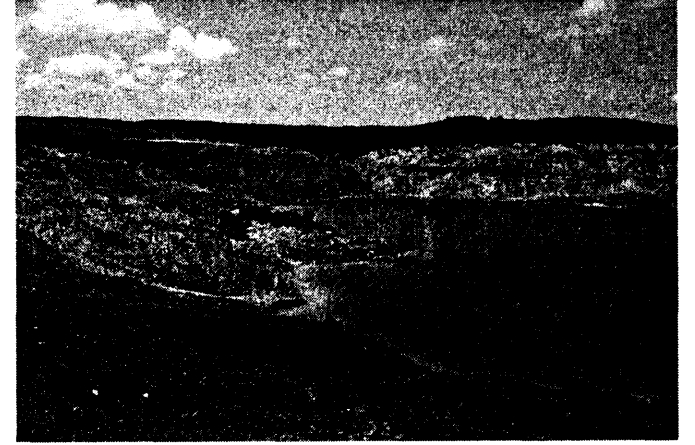
Şekil 2: Ağaçlı Yöresi Açık Maden Alanı (Haziran,2005)

Üretimi biten maden ocaklarının ekolojik açıdan kendini yenileyebilmesi için alanda birçok düzeltmeler yapılmalıdır. Göz önünde bulundurulması gereken ilk husus ağaçlandırmaya uygun materyalin üste serilmesini sağlamaktır. Özellikle kil ve ağır balçık materyali ile kömür üst malzemesi mümkün olduğunca derine gömülmelidir (KANTARCI 1988). Daha sonra bitkilendirme, stabilizasyon, yol, arıtma tesisi gibi rehabilitasyon çalışmaları yapılmalıdır. Ağaçlı'da üretimi biten maden ocaklarının yaklaşık 600 ha'lık bölümünde yapılan rehabilitasyon çalışmalarında ise yalnızca bitkilendirme ile sınırlı kalınmış, stabilizasyon ve yer altı suyunun düzenlenmesi gibi çalışmalar göz ardı edilmiştir. Bitkilendirmede Yalancı Akasya ( Robinia pseudoacacia L.), Fıstık Çamı ( Pinus pinea L.) ve Sahil Çamı ( Pinus pinaster Ait.) gibi türler tercih edilmiştir.