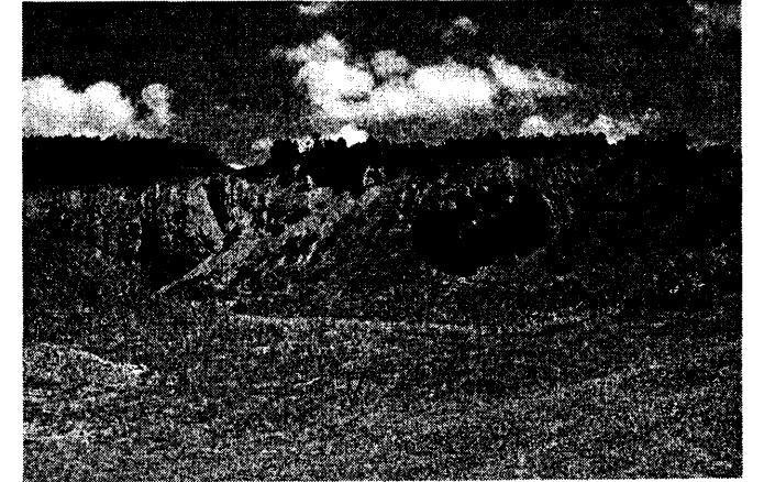
Şekil 3: Ağaçlı Yöresi Açık Maden Alanı (Haziran,2005)