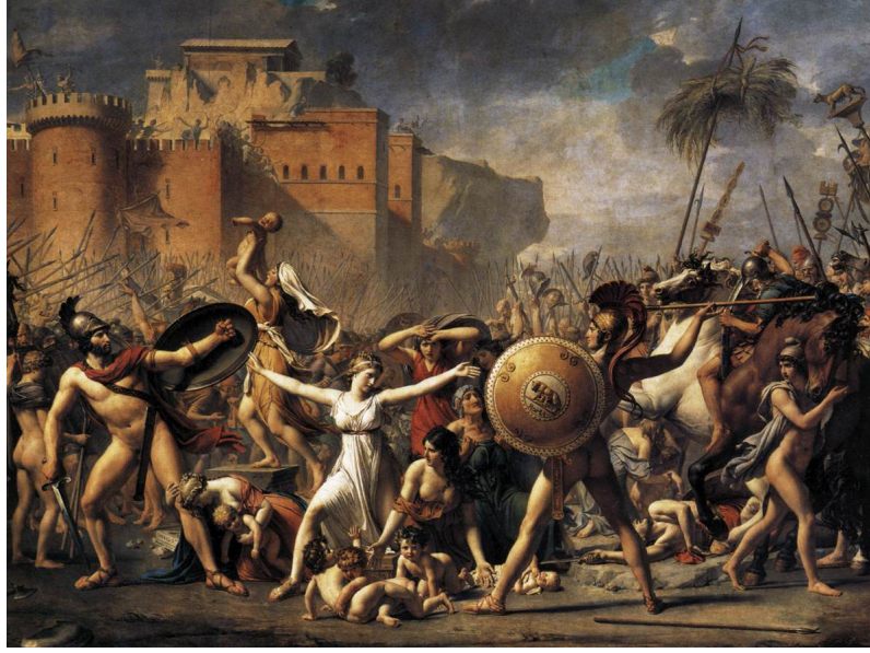
Resim:3 Jacque Louis David, Sabin Kadınları, 101,6 cm - 81.28 cm Tuval üzerine yağlı boya, Louvre Müzesi, Paris

Jacques Louis David, resimlerinde devrimi yüceltmek ve roma ihtişamına benzer bir etki yaratmayı amaçlayarak doğal hakkın, insanlık haklarının savaş tarafından etkilenmemesi gerektiğini anlatmaktadır. Sanatçının Sabin Kadınları (resim:3) adlı eserinde, Hersilia ve diğer Sabine Kadınlar sahneye hakim ve tabloda figürlerin yerleşimi, yüzlerin ifadelerinden topluluğun paniğinden patlama gibi görünmektedir. Resim kompozisyonu öne koymaktadır, resim yapısal ve konu düzenlemesiyle sanatsal gelişiminde bir dönüm noktasıdır. Resmin teması uzlaşma, terör ve egemenliktir. Tablonun en önemli kavramsal düzenlemesi savaşçı çıplak figürleriyle dikkat çeker. David, resmin temasında Sabine Kadınlar gibi bir zafer kazanmış, yumuşak arabulucu gibi ışık göstermek istiyor.