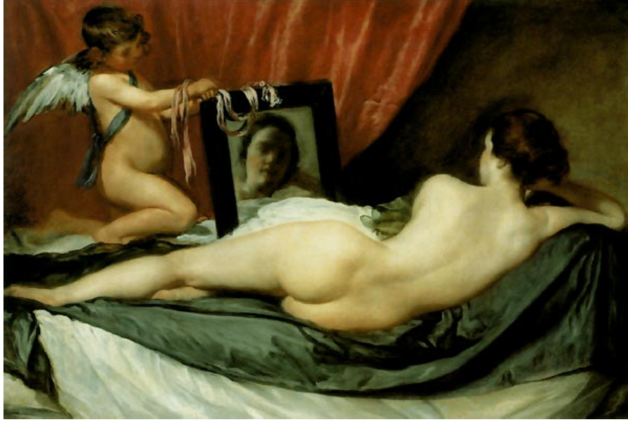
Resim: 5 Diego Velázquez, Aynadaki Venüs (Rokeby Venus) 1647 – 1651 122 x 177 cm

parçalanması sanatçıyı objenin parçalanmasına yöneltti (Yılmaz,2003:326). Kısacası, ülkelerin kendine özgü kültür politikaları devletin sanata ve sanatçıya bakış açısını yeni bir düşünceye dönüştürür.