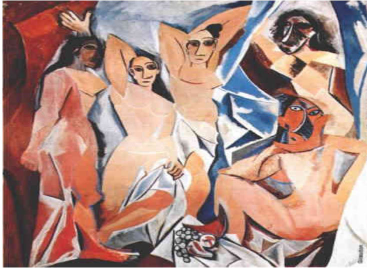
Resim: 6 Pablo Picasso, Avignonlu Genç Kızlar (1907) Çağdaş Sanat Müzesi,

Kadın temasını farklı bakış açısıyla ele alan kübizm sanatçıları, bütünü parçalanmasında kadını birçok farklı çalışmalarında kullandılar. Kübist sanatçılar yapıtlarında yüzeysel düzenlemeler, tuvallerine gazete kesiklerini ve duvar kağıtlarını da yapıştırarak kolaj tekniğini buldular. Resim görünen gerçeğin dışında gerçeklerden soyutlanmıştı. Gazete kesigi gerçek bir nesneydi ve resim bu yolla günlük gerçekliğe bağlanmış oluyordu. Picasso bunlara “realité parçacıkları” diyordu. Picasso'nun Avignon'lu Genç Kızlar tablosunun kübizmin başlangıç noktasını oluşturmaktadır (Fischer,2006:20).