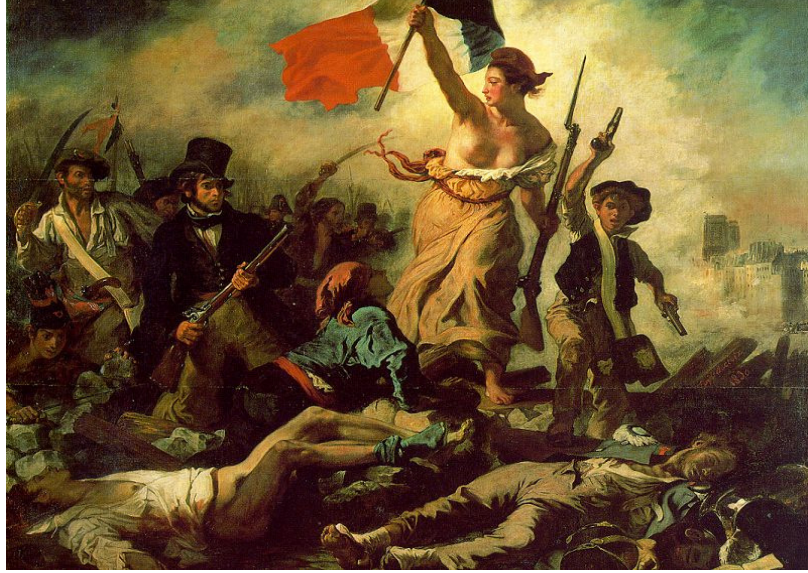
Resim: 1 Eugene Delacroix, Halka Yol Gösteren Özgürlük 1830, Tuval üzerine Yağlıboya, 260 × 325 cm, Louvre Müzesi, Paris

Delacroix'in Halka Yol Gösteren Özgürlük tablosu (resim:1) 28 Temmuz 1830 devrimi sırasında insanların özgürlük için mücadelesini anlatır. Delacroix'in devrim için siyasi bir ifadesini gösterir. Sanatçı tabloda savaşçıların, insanların özgürlük için mücadelesini ve çelişen duygularını figür temsilleriyle ifade ediyor. Kadın, özgürlük geleneksel bağımsızlık simgesini, şapka giymiş ve elinde silah tutan figür temsili ile birlikte üç renkli bayrak sembolü de özgürlüğü ifade eder. Burada aslında, kadının ifadesi ya da diğer figür temsilleri özgürlüğün soyut bir anlatımını ifade eder (Lynton,2004:95-100).