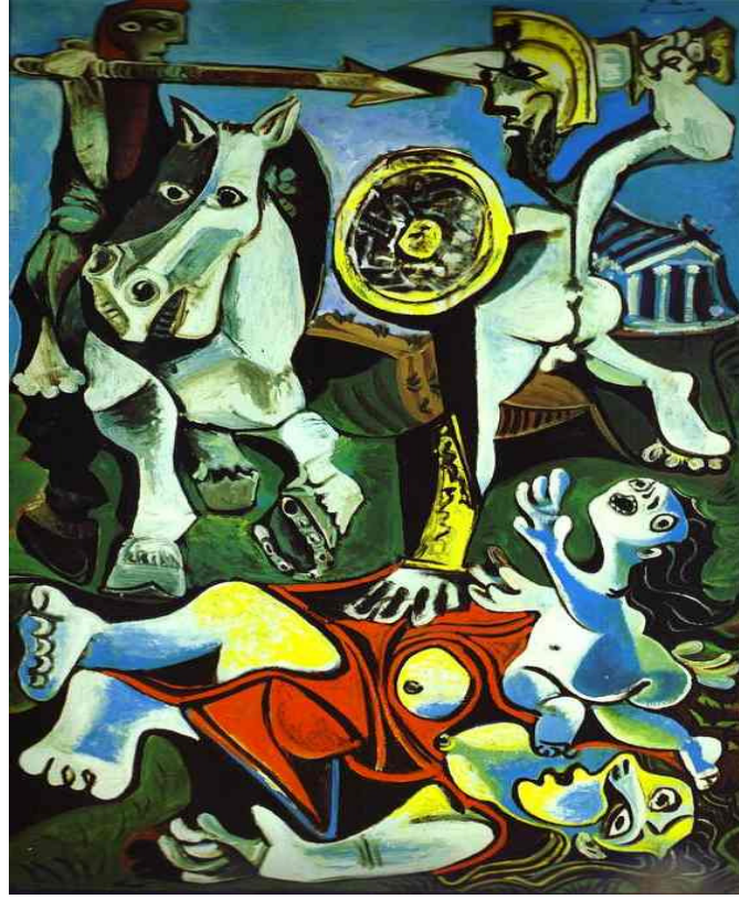
Resim:4 Pablo Picasso, Sabinlere Tecavüz, 1963, Tuval üzerine yağlıboya,

195 x 130 cm Güzel Sanatlar Müzesi, Boston, ABD