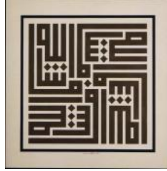
Resim 4-Stilize beşli "Allah" Resim 5-Kufî dördü "Maşallah"

Yazı, grafik tasarımın en önemli elemanı olduğu için Emin Barın'ın grafik tasarım konusunda da birçok amblem ve logo tasarlamasını, çeşitli grafik ürünler yapmasını sağlamıştı. Arap harfleriyle yaptığı kompozisyonlar tamamen grafik tasarım olarak tanımlanır. Eserlerinde Bauhaus, De Stijl ve Konstrüktivizmin etkileri açıkça görülmektedir. Emin Barın İsviçre'de yayınlanan Who is Who in Graphic Arts isimli kitapta yer almış ve eserleri yayınlanmıştır. Dördü "Lailaheillallah" kompozisyonu optik denge, "Mevlana" kompozisyonu ritim ve içerik için iyi birer örnektir. Eserler anlam olarak geleneğe bağlılığını sürdürürken, görünüm olarak geçmişle aralarında bir uçurum oluşturur. Bu durumu en iyi aydınlatacak nedenler ise klasik hat sanatımızı en ince detayına kadar incelemiş ve öğrenmiş olması; en az birincisi kadar önemli olan diğer etken ise Latin yazı grafiği, cilt ve kâğıt konusunda akademik eğitim almış olmasıdır. Klasik hat sanatından çok farklı görünümlere sahip olan grafik veya resim gibi algıladığımız eserlerinde, sözcüklerin geleneksel anlamlarından hiçbir şey kaybetmemiştir. 18 Klasik kabul ettiğimiz yazılardan Sülüs, Nesih, Ta'lik vb. yazılar konusunda Barın'ın hemen hemen hiçbir eserine rastlanmaz. Bunun en önemli sebebi bu yazı türlerinin büyük hat ustaları tarafından en üst seviyelere ulaştırılmış olmasıdır.