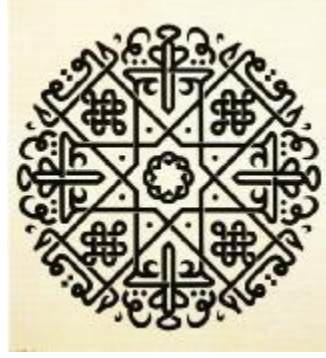
Resim 7-Küfi İstif