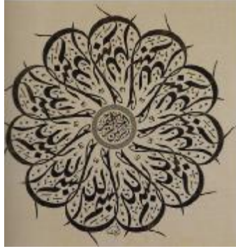
Resim 6- Divanî Besmele

Çalışmalarını genellikle Kûfî 19 ve Celî Divanî yazıların çağdaş yorumları yönünde yoğunlaştırmıştır. "Besmele, lâfza-i celal, Muhammed, kelime-i tevhid ve Türkçe bazı sözler üzerinde yoğun çalışmalar yapmış ve geometrik esaslı olan kûfî yazının hiç denenmemiş çeşitlemelerinde son derece başarılı örnekler vermiştir. Metnin tekrarı, belirli bir form içerisinde kompozisyonu, müsenna (aynalı) formdaki modern anlayışı ve renk ile malzemenin uyumu konularında, grafik tasarım becerisiyle, örneğine hiç rastlanmamış çalışmalar yapmıştır. Son derece modern ve yalın anlatımı ile grafik sanatlarının en güzel örneklerinden cihar yar-ı güzîn (dört halife) ve ehlibeyt isimlerinin bulunduğu levhaları saymak mümkündür." 20