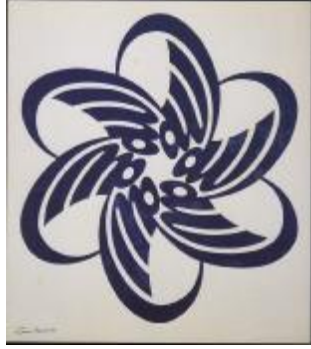
Resim 3-Stilize altılı "Allah"

olmuřtur. El yazması kltr zenginliklerimizin onarılıp kazandırılması konusunda ciddi bir hassasiyete sahip olan Barın cilt atlyesinde yalnız bu sahada hizmet verebilecek "Kitap Patolojisi ve Restorasyon" merkezi kurma hazırlıkları ierisindeydi. Bu konudaki dřnce ve uyarılarını 1977 yılındaki bir sempozyumda řu szleri ile dile getirmekteydi: "Dnyada İslami yazma eser sayısı bakımından Trkiye n sırada gelmektedir. Btn İslam leminin en deęerli yazma eserleri, Sultanın 'Halife-i Mslimin' olması nedeniyle Trkiye'de toplanmıř durumdadır. Bugn, yalnız Sleymaniye Ktphanesi'nde yz binin zerinde yazma eser bulunmaktadır. lkemizde bulunan yazma eser sayısının drt yz binin stnde olduęu gerektir. Ayrıca řu da bir gerektir ki, btn İslam lkelerinde bulunan yazma eserlerinin toplamı, Trkiye'de bulunanlarının ancak drtte biri kadardır. İlerinde sanat bakımından ok deęerli veya dnyada tek olarak bulunan yazma eserlerimizi aędař teknoloji kurallarına uygun řekilde restore etmek ve gelecek zamanın tahribatından korumak zorundayız." 17