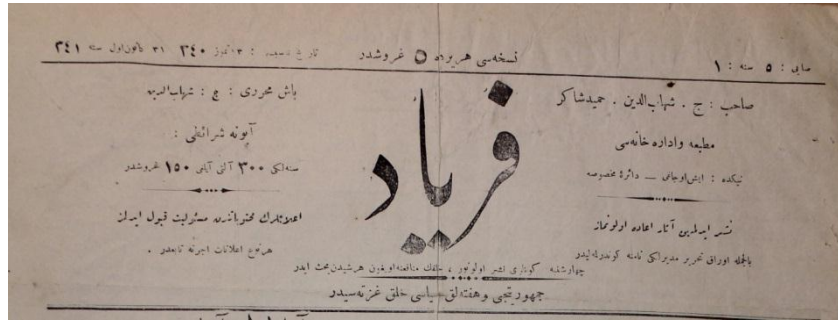
Feryad Gazetesi, 31 Kanunuevvel 1341