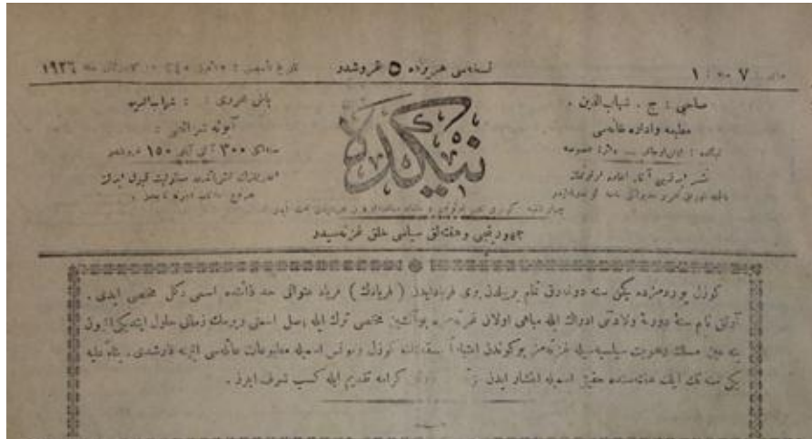
Niğde Gazetesi, 13 Kanunusani 1926