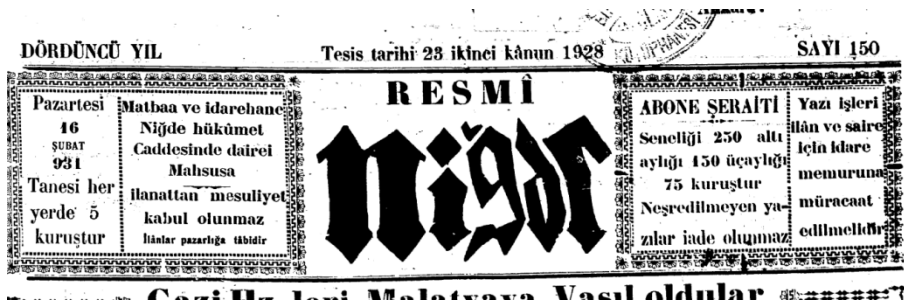
Resmi Niğde Gazetesi, 16 Şubat 1931