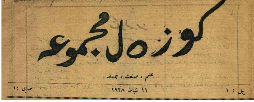
Güzel Mecmua, I (11 Şubat 1928)