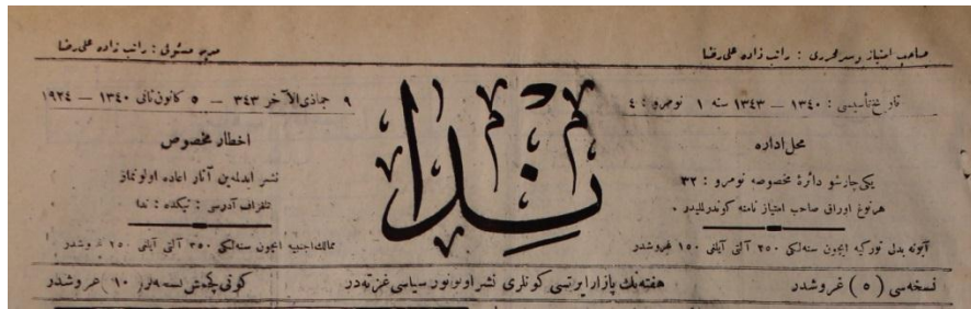
Nida Gazetesi, 5 Kanunusani 1340