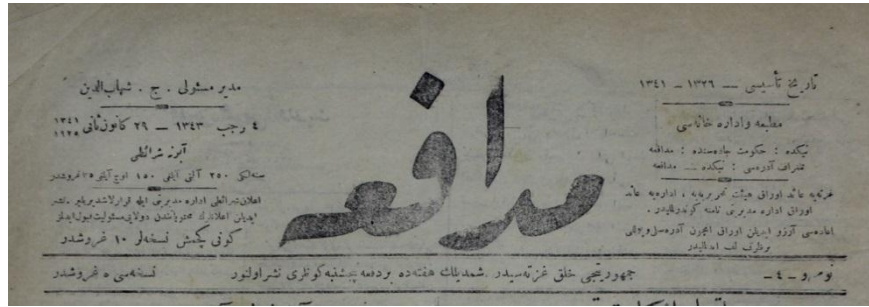
Müdafaa Gazetesi, 29 Kanunusani 1341