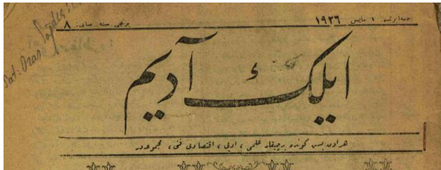
İlkadım (Mecmua), VIII (1 Mayıs 1926)