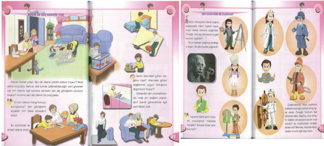
Tablo 4: İlköğretim 4. Sınıf Ders Kitaplarında kadın-erkek figürlerinin oranları