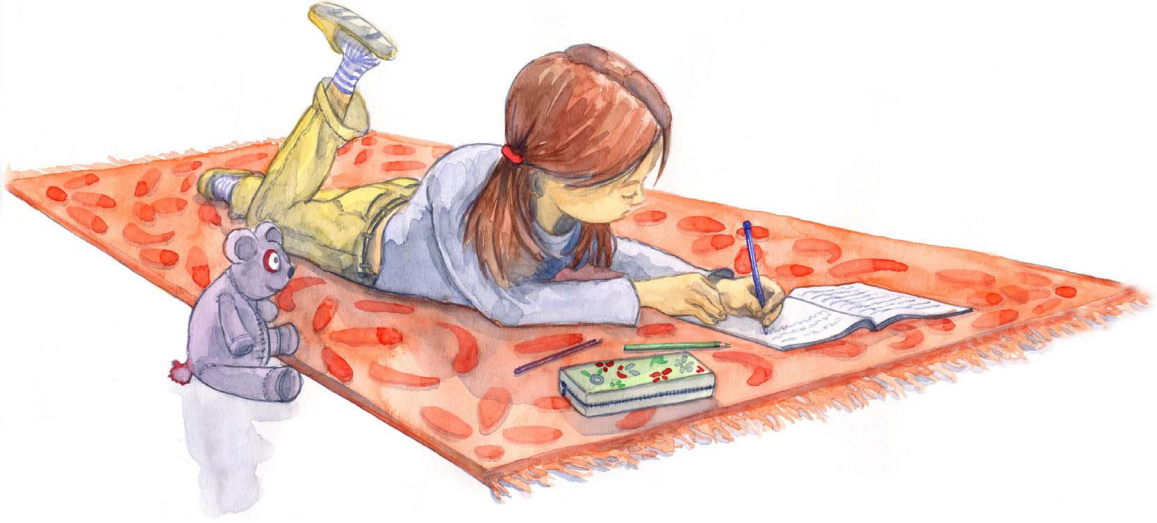
Resim-1 İlköğretim İkinci Sınıf Hayat Bilgisi Kitabı için bir resimleme, Ali Kılıç, 2005

leme yaklaşımıyla anlatılmalıdır. Bu anlatımın gerçekleşmesi ise çoğunlukla ders kitabı metninin yazarına bağlıdır. Çünkü çizer resimlemelerini bu anlatıma göre oluşturmak durumunda kalır.