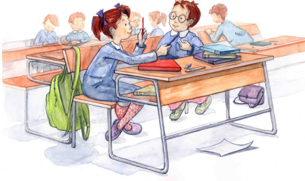
Resim-2 İlköğretim İkinci Sınıf Türkçe Kitabı için Ali Kılıç, 2002, resimleme önerisi, Ali Kılıç, 2002

Ders kitaplarında yer alan resimlemeler çocukların kavrama, kıyaslama ve algılama yetilerini geliştirirler. Konuyu kavramaları daha kolay ve zevkli hale gelir. Çocuğun beğeni ve seçim yapmasına olanak veren resimlemeler, güzel-çirkin, iyi- kötü vb. birbirine zıt değerlerin de ayrımına varmalarını sağlamaktadır. Sanatsal nitelik taşıyan bu görsel elemanlar, çocukların, konulara, olaylara ve toplumsal ilişkilere farklı bakış açıları ile bakabilmelerine olanak sağlayacaktır.