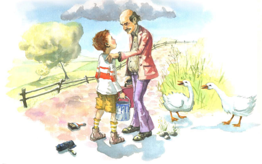
Resim-3 Bir metin için hazırlanmış resimleme,

İlköğretim okullarının özellikle birinci kademesindeki çocuklar için ders kitaplarında yer alan resimlemeler, zihinsel duyuşsal gelişim açısından çok önemlidir. Kitapların dili nasıl çocuk psikolojisine uygun olarak işleniyorsa, resimler de o yaklaşımla işlenmelidir. Nasıl bir ders kitabını her okuma-yazma bilen yazamazsa, bu resimlemeleri de çizimden biraz anladığını düşünen herkes çizmemelidir. Resimlemeler, metinlerin resim diliyle yorumlanması ilkesine dayalı olmalı ve çocuğun seviyesine uygun olmalıdır. Çizerin de en az yazar kadar bilgili, konuya hakim ve alanıyla ilgili sağlam işler çıkarabilecek yetkinlikte olması gerekmektedir. Tüm resimlemelerde estetik bakış açısı olmalıdır. Özellikle ilköğretim birinci ve