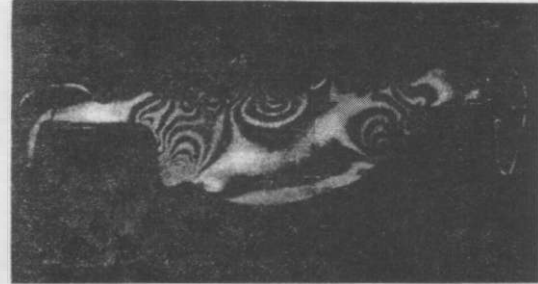
Resim 1. Metal desteksiz porselen köprünün polariskop cihazındaki görüntüsü.

Metal desteksiz köprüde, destek dişlerin köprü gövdesine bakan aproksimal yüzlerinde yoğun kuvvet çizgileri gözükmemektedir. Özellikle bu bölgedeki basamaklarda kuvvet çizgileri sık ve sayıca çoktur. Bu da bu bölgelerin şiddetli derecede kuvvete maruz kaldığını göstermektedir. Köprü gövdesinde özellikle kuvvetin uygulandığı kısımda, yoğun kuvvet çizgileri gözükmemektedir. Destek dişlerin köprü gövdesine bakan yüzeylerinde yoğun kuvvet çizgileri görülmesine karşın, diğer aproksimal bölgelerde kuvvet çizgileri gözükmemektedir (Resim 1).