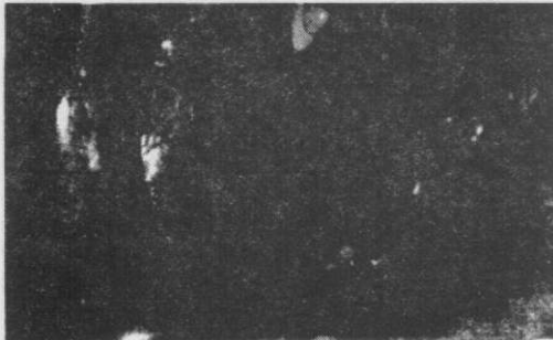
Resim 1. Hastanın buccal mukozasında izlenen lichen planus.

Hasta, değerlendirme ve tedavi amacı ile kulak, burun ve boğaz anabilim dalına gönderildi.