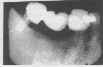
Resim 2. Olgumuzun 3 yıl sonraki radyografik görüntüsü.