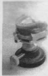
Resim 2. Mum duvarlı oklüzal yüzeyi yere paralel konumda tutulan algı modeli

edilen komparatör aracılığı ile ölçüm işlemlerine geçilmiştir. Bunun için surveyorun alt tablasına tespit edilen algı modeli üzerinden mum duvarlı kaide plaklar çıkarılmış modelin kret yüzeyinin en çıkıntılı kısmı komparatörün ucuna düşecek şekilde alt tabla hareket ettirilerek bulunmuştur. Sonra kretteki bu çıkıntılı noktadan teğet olarak geçeceğini varsaydığımız çığneme düzleminin (Şekil 1) altında kalan kret yüzeyleri arasındaki mesafelerin ölçümleri sağ ve sol kesici, premolar ve molar bölgelerinde 0.01 mm hassas ölçen komparatörle yapılmıştır (Resim 3).