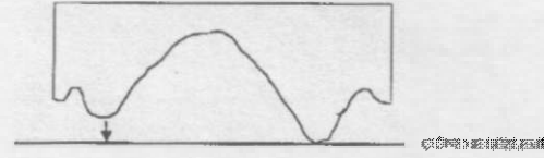
Şekil 1. Alınasal yönden kretlerin oklüzal düzleme göre durumu.