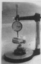
Resim 3. Kret yüzeylerinin çığneme düzlemine uzaklıklarının ölçmek için kullanılan komparatör

Bulunan değerler istatistiksel olarak Varyans Analizi ile "t" testi testine göre değerlendirilmiştir.