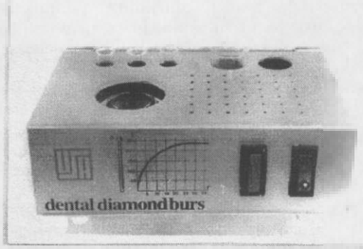
Şekil 1. Glass Bead Sterilizer.