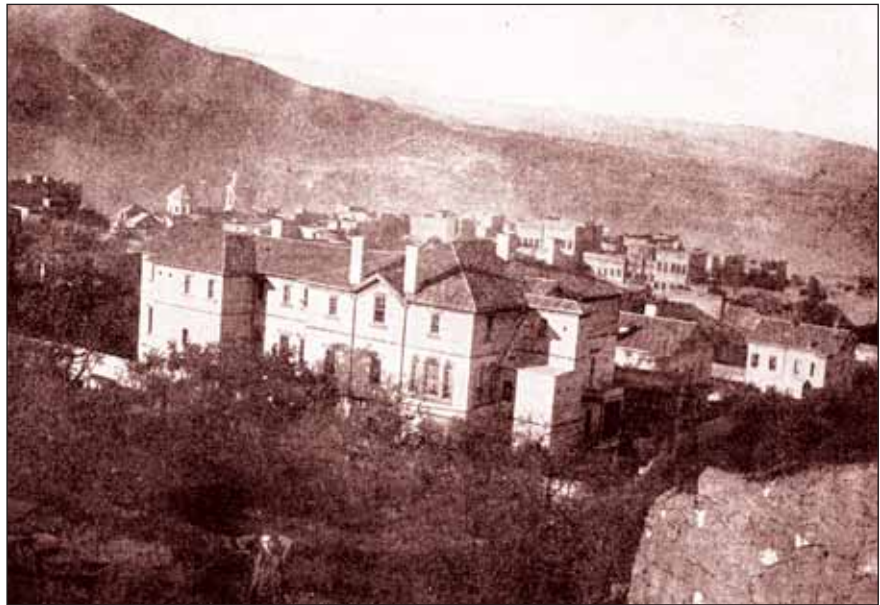
Resim 2. Ön planda Talas Amerikan Hastanesi ve hemen arkasında yer alan dispanser binaları.

Bu dönemde Talas'ın nüfusu 10.000 olarak verilmektedir. 20 yıl önce Dr. Dodd'un başlattığı çalışmalara, 7