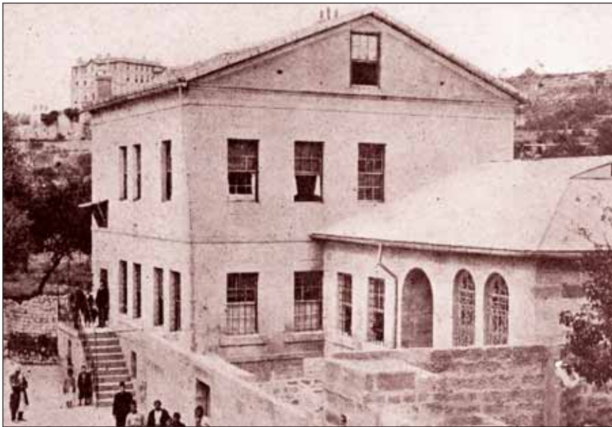
Resim 3. Önde Talas Amerikan Hastanesi Dispanseri ve geri planda Talas Amerikan Koleji.

kuduz köpeklerin ısıracağı 24 çocuk İstanbul'a gönderilerek 14 gün süren tedavileri yaptırılır. Hastaların 1/3'ü biri Müslüman, kalanı Hıristiyandır. Dönemin politik şartları nedeniyle çok sayıda Ermeni ve Rum Hıristiyan ABD'ne göç eder. İki yıl aradan sonra hemşire okulu açılarak birinci sınıfa 3 öğrenci alınır. Okulun eğitim dili İngilizcedir. Bu arada misyonerlik faaliyeti sessiz ve mütevazı bir şekilde yürütülür. Önce güven kazanılır, sonra yaşam tarzı değiştirilir. Yatan hastalarla kişisel görüşmeler, pazar sabahı toplu dualar yapılır. Bu alandaki çalışmalarını nedeniyle Pastör Mibar Muşeryan'a ve pazar akşamları için de Vartabar Garabetyan'a şükran duyulduğu belirtilmektedir. Benzer çalışmalar kadınlar için de yapılır. Bu dönemde, Board, 2.000 dolar bağışta bulunur. ABD'den birçok kişi her yatak için 150 dolar yardımda bulunur. Bu arada 2'si ampiyem nedeniyle olmak üzere, çeşitli hastalıklardan 7 kişi kaybedilir.