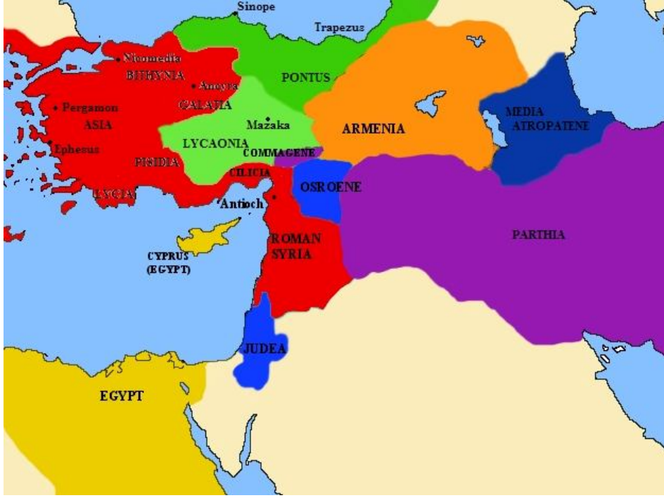
Harita 2: M.Ö. 50 Ön Asya