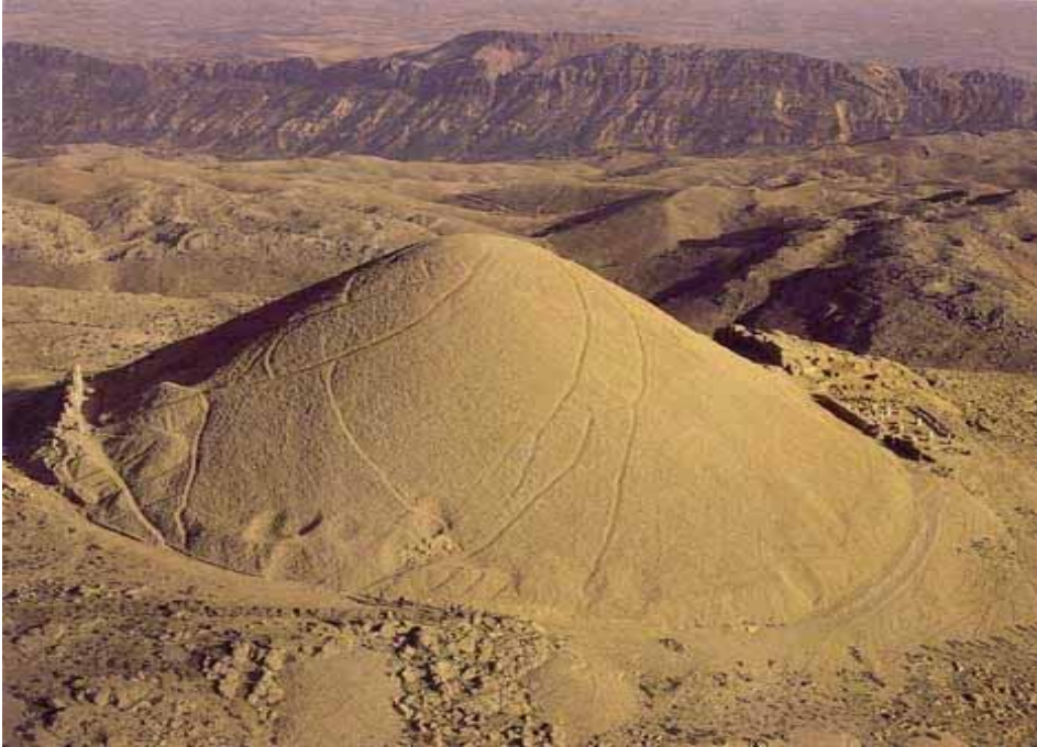
Resim 3: Tümülüs