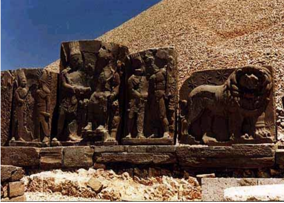
Resim 2 : Batı Terası