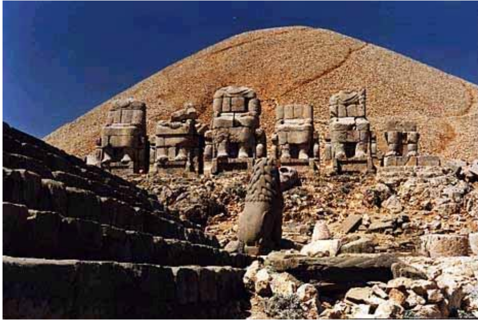
Resim 1 : Doğu Terası