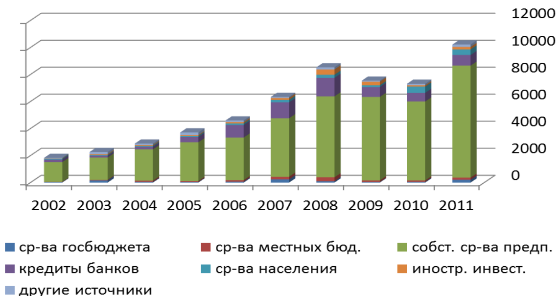
Рис. 1 Источники инвестирования в основной капитал Полтавской области за период с 2002 по 2011 годы, млн.грн (разработано авторами по данным [5])

Инвестирование в основной капитал в Полтавском регионе осуществляется за счет многих источников. Источники инвестирования в основной капитал Полтавской области за период с 2002 по 2011 годы представлены на рисунке 1.