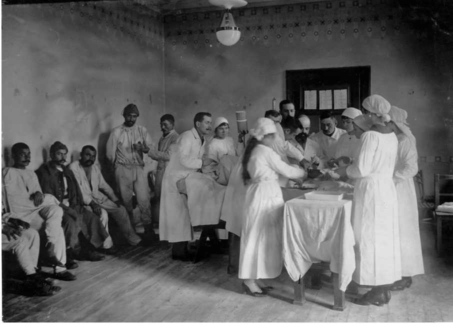
Kırım Harbi Sırasında Yapılan Bir Ameliyat