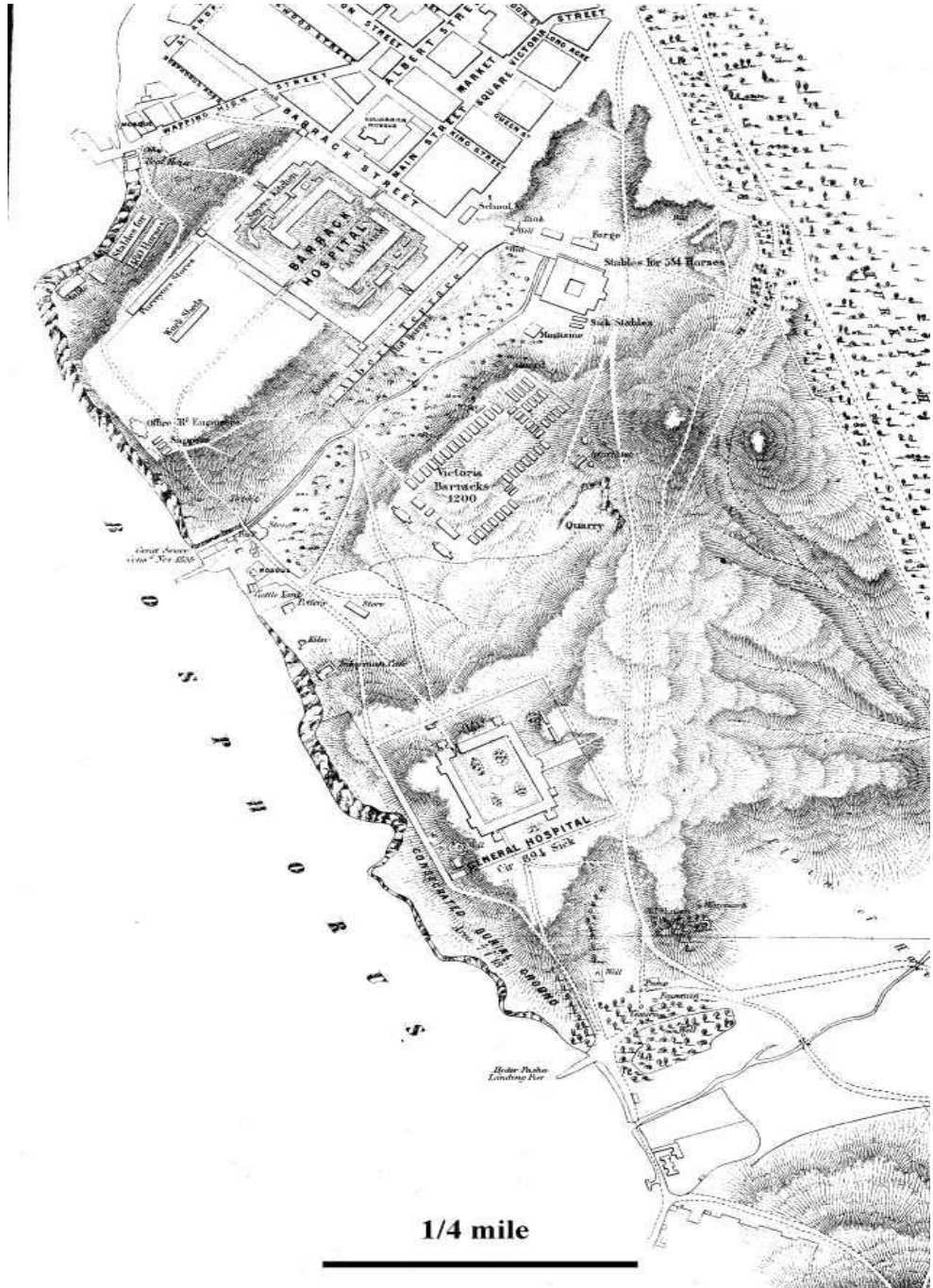
İstanbul'da, Müttefiklere Ait Hastaneleri Gösteren Bir Başka Harita