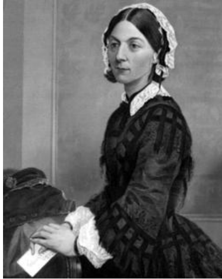
Kırım Harbi Sırasında İstanbul'da Görev Yapan İngiliz Hemşire Miss Florence Nightingale