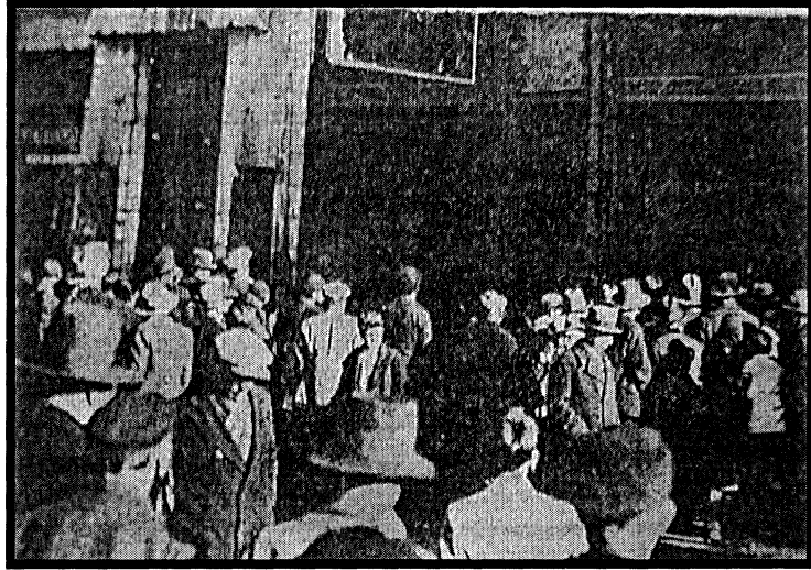
Son Posta, 27 Şubat 1933

“Nümayişin Beyoğlu’ndeki manzarası böyle mahşeri bir kalabalık gösteriyordu”