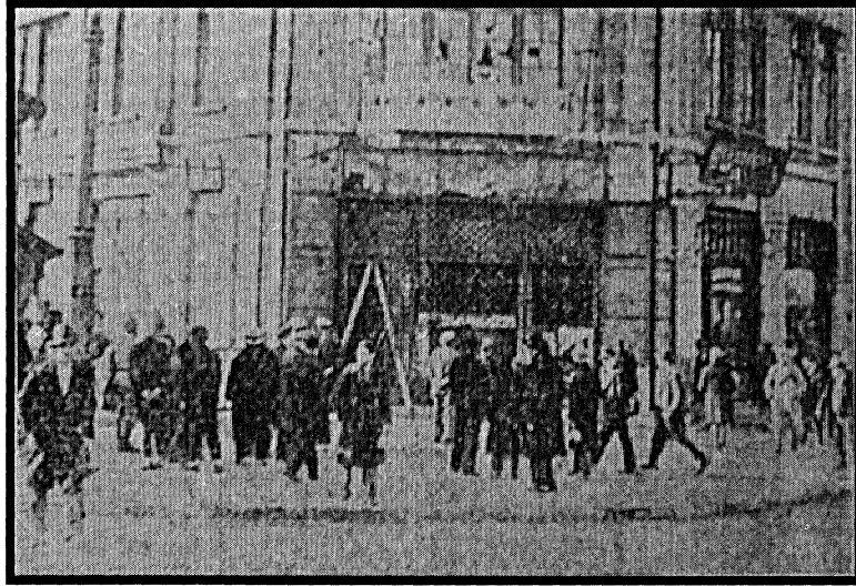
Son Posta, 27 Şubat 1933 “Karaköy Şubesi”