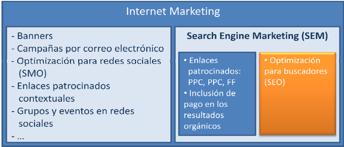
Figura 1. “Jerarquía de estrategias de marketing en Internet”.

El marketing en buscadores o SEM puede definirse genérica y formalmente como aquellas acciones del marketing en Internet dirigidas a incrementar el tráfico de visitas de un sitio web, tratando de influir en el posicionamiento que éste tiene en los motores de búsqueda (Posada, 2008). La (figura 1) muestra su encaje en el contexto de las estrategias SEM.