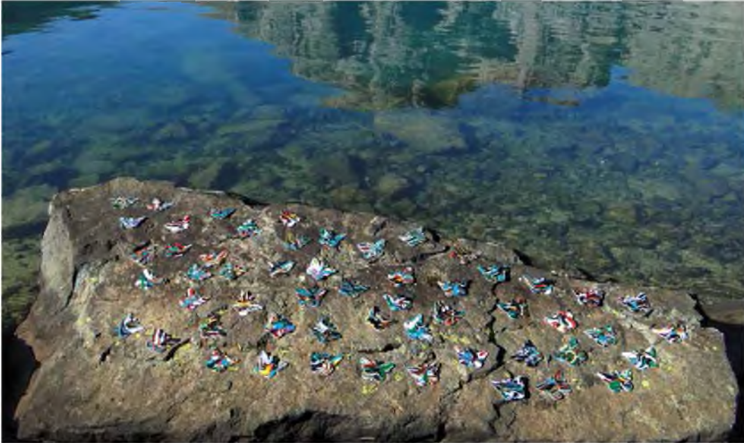
Şekil 8: Yücel Dönmez, “Doğa Düzenlemesi”, 2010

lebekleri ile sanatını doğaya taşıyarak, doğa düzenlemesi adını verdiği yerleştirme çalışmasıdır (Şekil 8).