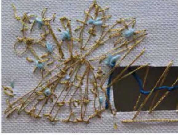
Şekil 10: Füsun Onur “Çeşitlemeler” 2012

Arter Galeri’de kurgusal bir dizi olarak gerçekleştirilen “Haset, Husumet, Rezalet” sergisinin 2.sinde toplumsal, kültürel ve siyasal belleğin bugünkü durumunun sanat diline aktarılması için bu üç kavram kullanılmaktadır. Selim Birsal’in bu sergide ki “Arka Bahçede Yetiştirilir” çalışması önemli yerleştirme örneklerinde biridir (Şekil, 11).