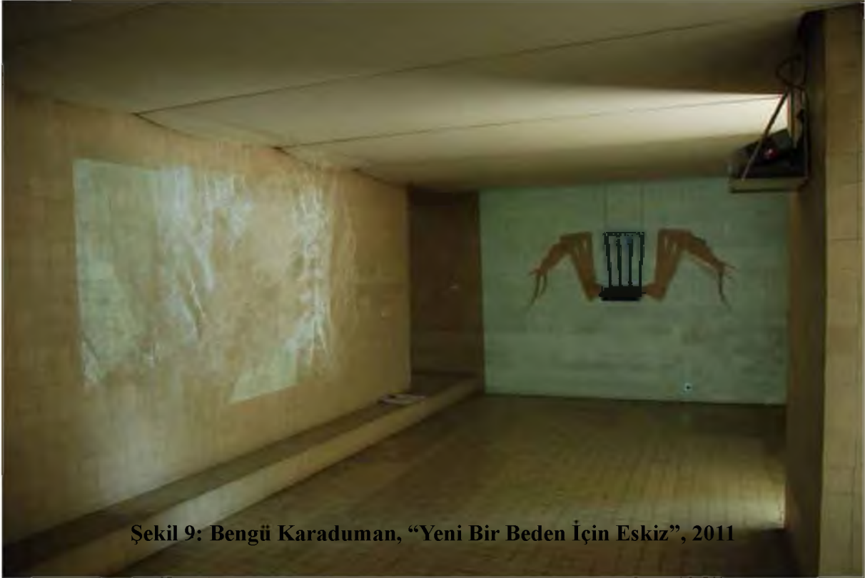
Şekil 9: Bengü Karaduman, “Yeni Bir Beden İçin Eskiz”, 2011

Bengü Karaduman, galerinin mimari yapısından ilham alarak, galerinin iki odasını bir kurgu içinde kullanmıştır. İçeri girildiğinde izleyicileri demirden bir sandalyenin hareketli bir örümceğe dönüştüğü video heykel karşılıyor. “yeni bir beden için eskiz” adını verdiği çalışmasında sandalye yerleşik düzeni betimlerken, örümcek ise mitolojik olarak ördüğü ağ ile çağdaş yaşamda ki yaşam döngüsünü ve bireyi sembolize ediyor (Şekil, 9).