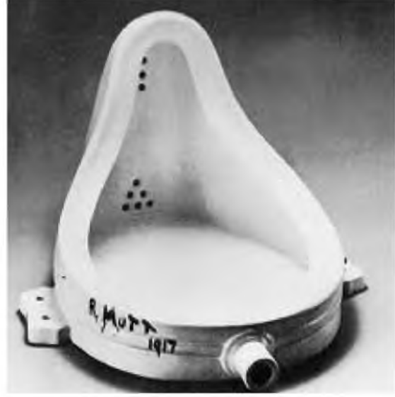
Şekil 1: Marcel Duchamp, “Çeşme “ 1917

kalıpları yıkar, kendine özgü sorgulama biçiminde biz de onunla işbirliği yapmış oluruz. Öne sürdüğü fikri benimseyebiliriz; ama onu biçimlendiremeyiz, satamayız, yeniden üretemeyiz veya onu bir kağıt ağırlığı gibi kullanamayız “(Lynton, 2004). Bazı kaynaklarda obje sonrası sanat olarak da geçen kavramsal sanat, klasik sanattan köklü olarak kopar, objeyi, resmi ve heykeli yadsır. Amacı sanatsal üretimi fetiş ve meta olmaktan çıkarıp seyircinin seyrine edilgen olarak sunulmasına karşı bir girişimdir. Bu tanıma göre fetişleşmiş nesneye gerek yoktur ve sanat düşünsel bir süreçtir (Şenel, 2009). Joseph Kosuth, Kübist sanatçıların resim dili ile sanatı bir dereceye kadar soruşturduklarına inansa da, ona göre Marcel Duchamp sanatın doğasını gerçekten sorgulayan ilk sanatçıdır. Çünkü Duchamp hazır nesnelere kullanarak yeni bir dil konuşmaya başlamıştır ve hazır nesne kullanımını biçimden işleve, görünüşten kavramaya yöneltmiştir (Atakan, 2008). Duchamp, modern sanat estetiği, sergi, müze, eleştiri, tarih, değer, galeri gibi kavram ve kurumları hazır nesnelere yadsımaktadır. Çeşme isimli çalışmasında, gündelik hayata ait bir nesneyi sunuşunda ki farklılık, onun yararlılık bakımından taşıdığı önem, getirdiği yeni bakış açısı tarafından ortadan kalkmıştır (P. Bürger, 2003).