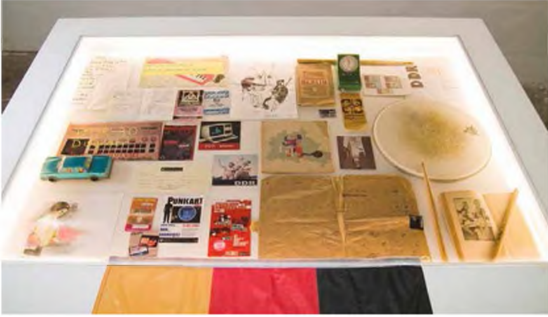
Şekil 7: Merve Şendil, “Underscene Project” 2008

Gündem yaratan sergilerden bir diğeri de 2010 yılında Yücel Dönmez tarafından İstanbul moda burnunda gerçekleştirilen barış ke-