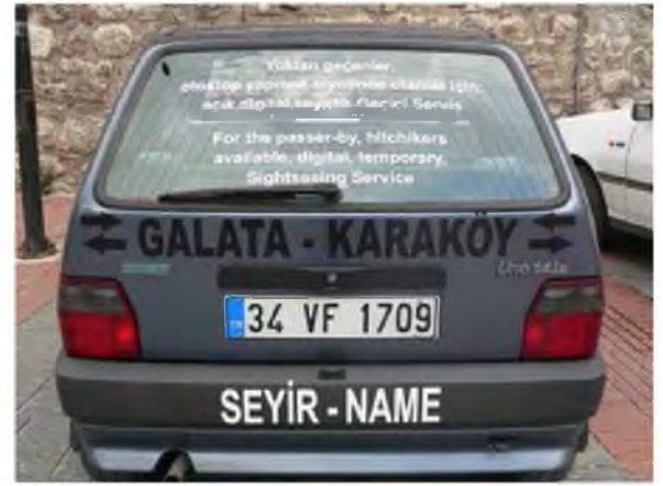
Şekil 3: Gülçin Aksoy, “Seyir-Name” 2005

İstanbul Modern’de düzenlenen “Kurmacaıyla Gerçek Arasında” başlıklı sergide, Esra Esren “İsveççe Konuşabilseydin...” (şekil 4) isimli fotoğraf, video ve yerleştirme çalışmasında toplumsal davranışların, dilsel sınırlar, kimlikler, kültürel öğeler üzerinden şekillenmesini ele almıştır.