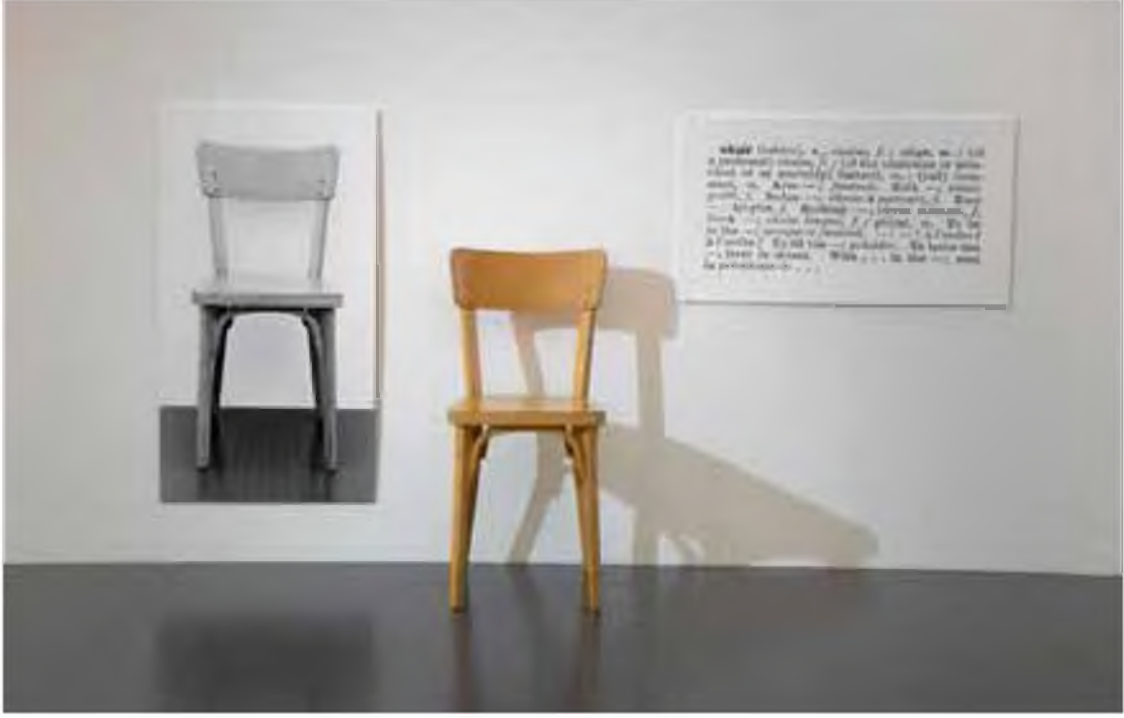
Şekil 2: Joseph Kosuth, “Bir ve Üç İskemle” 1965 Modern Sanat Müzesi, New York