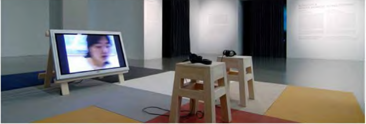
Şekil 4: Esra Esren, “Keşke İsveççe Konuşabilseydin” 2001

2001 yılında Stockholm’de katıldığı İsveççe kursunda, diğer katılımcılar İsveççe konuşabilirdi ne söylemek isterlerdi? düşüncesinden yola çıkarak, katılımcılardan kendi dillerinde yazmalarını istemiş, aldığı yanıtlar birbirinden farklı duygular içeren cümlelermiş. Daha sonra bu cümleler İsveççeye çevrilmiş, ve öğretmen eşliğinde sürekli düzeltmeler yapılarak katılımcılara yazdıkları İsveççe cümleler okutulmuş ve video kayıtları yapılmış.