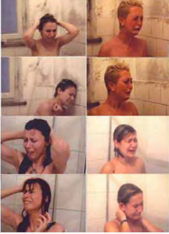
Şekil 6: Ferhat Özgür, “Arınma (Katarsis)”, 2003

Güncel sanat çalışmalarıyla, teorik konular üzerine metinler yazan çağdaş sanatçılardan