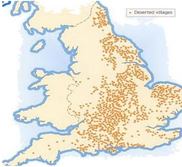
Harita 2. XV. Yüzyıla Kadar İngiltere'de Nüfusunu Kaybeden Köyler Ekonomik Etkiler

Bazı yerlerde nüfus azalması yaşanırken bazı yerlerde de nüfus tamamen yok olmuştur. Nüfus tespiti konusunda diğer ülkelere göre daha çok kayıt tutulmuş olan İngiltere için bu konuda bilgi verebilmekteyiz. İngiltere'deki bazı bölgeler bu yoksunluğa örnek olarak gösterilebilir. Aşağıdaki resimde 1400 yılına kadar İngiltere sınırları içerisinde terk edilmiş durumda olan yani vebanın nüfusu yok etmesiyle ıssız kalan köylerin dağılımını gösterilmektedir. 40