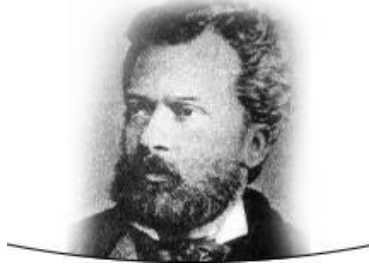
Vatan ve Hürriyet şairi olarak bilinen Namık Kemal

üretiyordu. Birinci Meşrutiyet 9 'in ilanıyla (1876) umutlanan bu ilerici kesimler, Sultan II. Abdülhamid'in meşrutiyeti ve meclisi feshederek kendi mutlakiyetçi istibdat (baskı rejimi) yönetimini ilan etmesiyle yeni arayışlara başlıyorlardı. İttihad-ı Osmani Cemiyeti 10 veya sonrasında aldığı ve daha iyi bilinen adıyla İttihat ve Terakki Cemiyeti, iyi eğitim almış toplumsal kesimlerden büyük destek alarak hızla büyüyor ve istibdat rejimine rağmen varlığını özellikle yurtdışında sürdürmeyi başarıyordu. II. Abdülhamid'in büyük toprak kayıplarına yol açan 11 ve baskıcı ve başarısız yönetimi karşısında orduda ve devlet kademelerinde hızla destekçi sayısını arttıran İttihat ve Terakki Cemiyeti, yurtdışındaki Jön Türk hareketlerini de bir merkez altında toplamayı başararak istibdat yönetimini yıkmanın yollarını arıyordu.