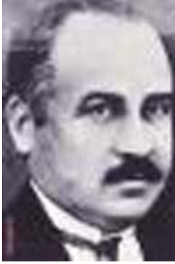
Ziya Gökalp çağının çok ötesinde bir düşünürdü

etkisinde oluşturdukları Halkçılık ilkesi ve Devletçilik anlayışı da muğlaklığına rağmen Kemalist Devrim'e önemli ölçüde ilham kaynağı olmuştur.