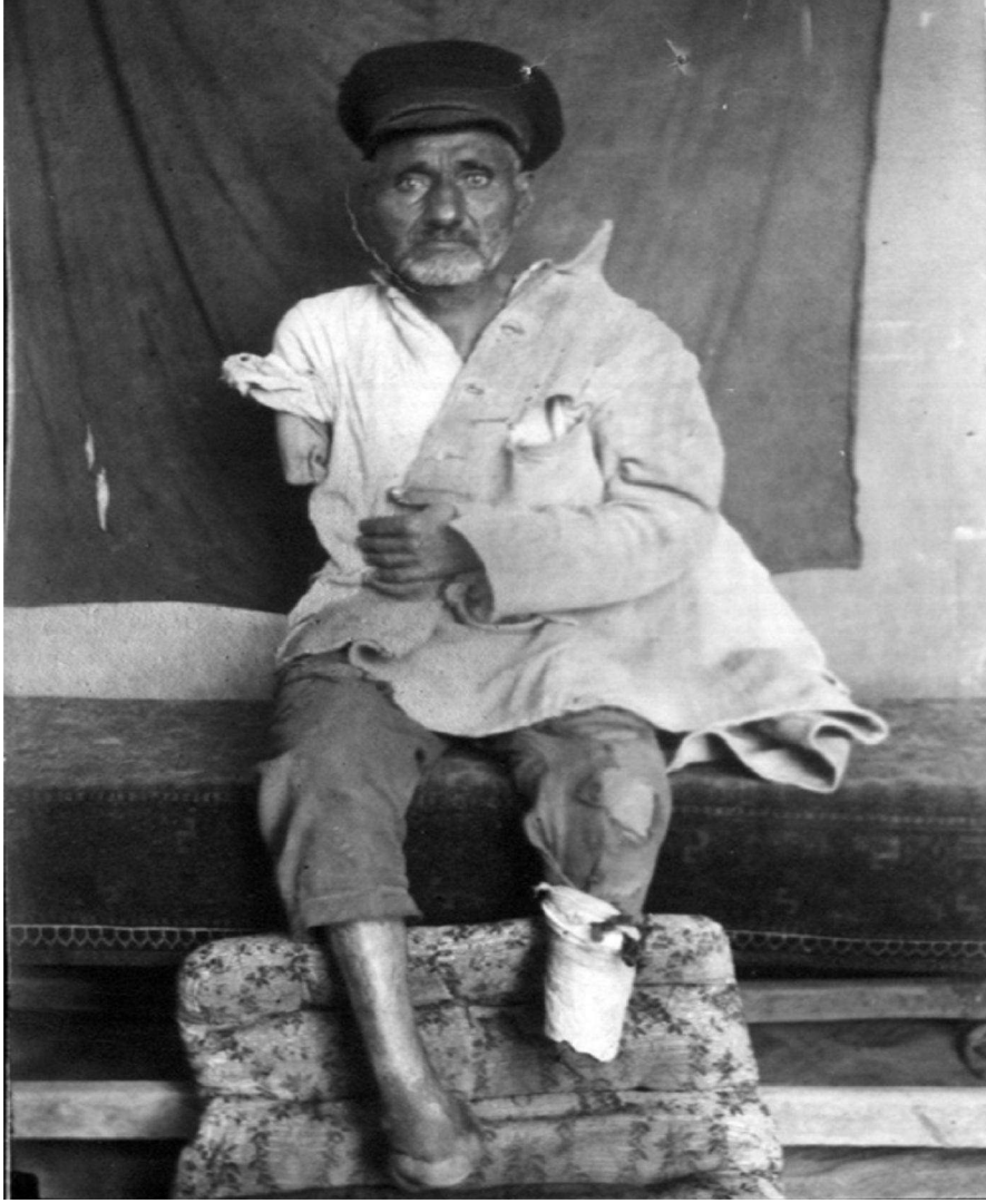
İsmail Hoşbatın'ın dilekçesine 'istişatname' olarak eklediği fotoğraf.