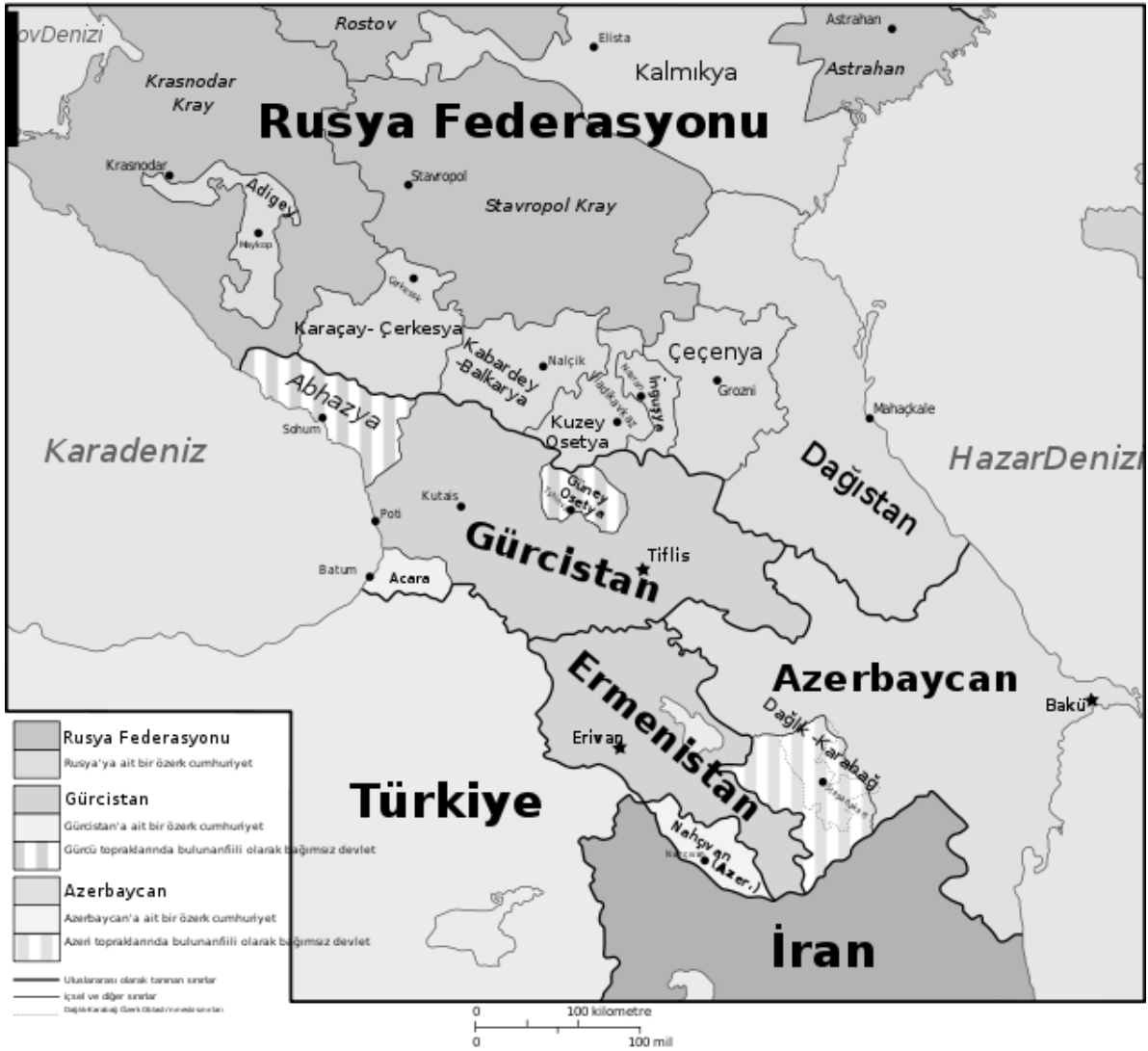
Şekil 1. Kafkasya Bölgesi