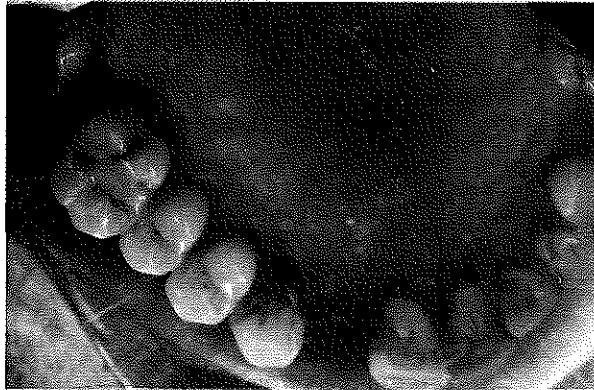
Resim : 1

ma yakımlarıyla İ.Ü. Diş Hekimliği Fakültesi Periodontoloji Anabilim Dalı Kliniği'ne başvurdu. Hastanın ağız içi muayenesinde ağız hijyeninin kötü olduğu, periodontal yıkımla birlikte bazı dişlerin eksik olduğu ve üst çene vestibül ve palatinal bölgenin hemen tamamını kaplayan kırmızı renkte, yer yer ülserli hiperplazik karakterde, kronik olduğu izlenimi veren lezyon görüldü (Resim 1, 2). Alt çenede kronik marginal gingivitis dışında bir patoloji saptanmadı. Bölgesel lenf düğümleri palpasyonda sert ve hafif ağrılıydı. Anamnezinde üç aydır lezyonların var olduğunu bildiren hasta, herhangi bir sistemik hastalığı olmadığını belirtti. Fizik muayenede hasta sağlıklı görünümdeydi. Yapılan tetkiklerde kan tablosu lökositoz dışında normal sınırlar içerisinde bulundu. Daha sonra hastanın üst çene vestibül ve palatinal bölge-lerinden iki ayrı biyopsi alındı ve incelenmek üzere İ.Ü. Diş Hekimliği Fakültesi Patoloji birimine gönderildi.