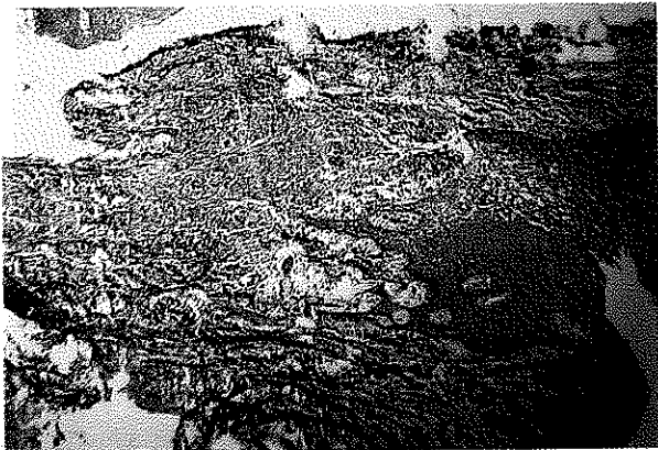
Resim 3: Palatinal yüzeyden alınan biyopsi örneği (H.E.x40)

zengin, iltihapsal infiltrasyon saptanmaktaydı (Resim 4). İki biyopsiye de tüberküloz tanısı konuldu. Hastanın İ.Ü. İstanbul Tıp Fakültesi İç Hastalıkları Anabilim Dalı'nda yapılan sistemik incelenmesi sonucunda başka organlarda tüberküloza ait bulgular saptanmamıştır. Sistemik tedavisine iç hastalıkları kliniğinde başlanmış, ağız bakımı ve diğer oral problemleri tarafımızdan kontrol altına alınmıştır.