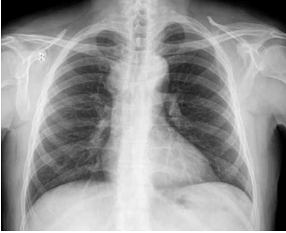
Şekil 1: PA Akciğer grafisi