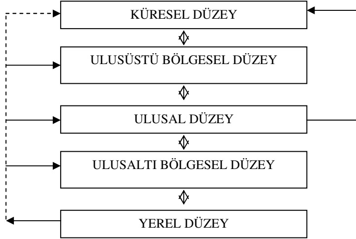
Şekil 2. Uluslararası Bölgesel Politikaların Diğer Düzeylerle Etkileşimi