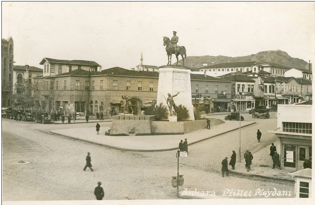
Şekil 9. Ulus Meydanı’nda bulunan Zafer Anıtı ve arkada Taşhan.

...Ulus Meydanı’nın Ankara Kalesi ile tarihsel olarak kurduğu görsel ilişki de başka bir değerlendirme konusu olmuştur. Bu kapsamda, Meydana katkısı sınırlı olan yüksek katlı kamu yapıları ile bunların ortasındaki Anafartalar Çarşısı’nın blok olarak ortadan kaldırılması ve bu alanların Meydan ile açık alan sis-