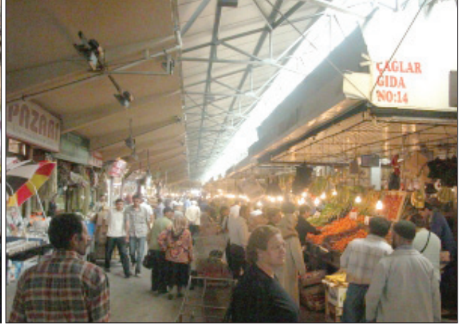
Şekil 7. Ulus Sebze Hali (2013).