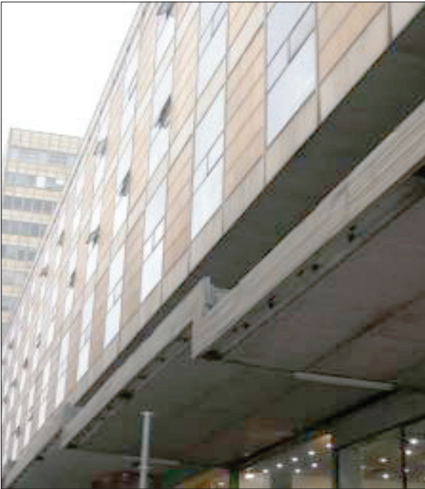
Şekil 6. Yıkılmak istenen Anafartalar Çarşısı ve Gümrük Müsteşarlığı binası.

Ankara İmar ve Emlak İşletmesi T.A.Ş. tarafından 1967 yılında düzenlenen mimari proje yarışması sonucunda elde edilen projenin müellifleri, dönemin tanınmış mimarlarından Ferzan Baydar, Affan Kıvrımlı, Tayfur Şahbaz'dır.