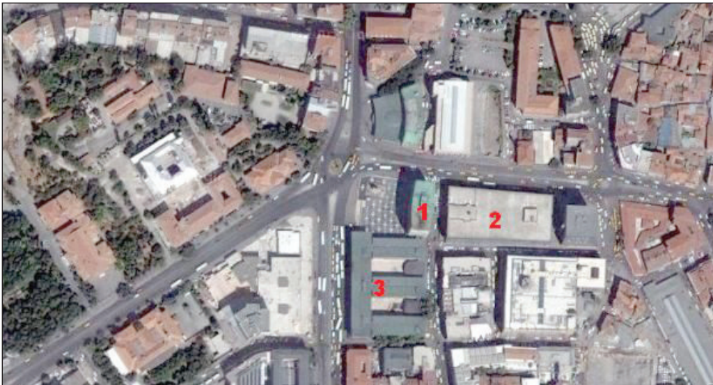
Şekil 5. Ankara Tarihi Kent Merkezi Yenileme Alanı Koruma Amaçlı Uygulama İmar Planı içinde dava konusu olan 1.Gençlik ve Spor Genel Müdürlüğü, 2. Anafartalar Çarşısı, 3. Ulus İşhanı görülmektedir.

Plandan da görülebileceği gibi yapılmak istenen Taşhan Çarşısı, orta kesimde 3 adet (Şekil 5), biri de Ulus İşhanı olmak üzere tescillenmiş en az 4-5 yapının koruma alanı içinde yer almaktadır. 2863 Sayılı Kanun uyarınca; koruma kurullarının görev yetki ve çalışma usullerini belirleyen 57. maddesinde; (5226 ile değişiklik yapılan d bendi) "Koruma amaçlı imar planları ile bunların her türlü değişikliklerini inceleyip karar almak" hükmü ile de imar planı değişikliklerinde karar alma yetkisinin Ankara Kültür ve Tabiat Varlıkları Koruma Bölge Kurulu olduğu ve Ankara Büyükşehir Belediyesi tarafından bu Kurul'dan görüş alınmadan koruma planı değişikliğine gidildiği açıkça görülmektedir.