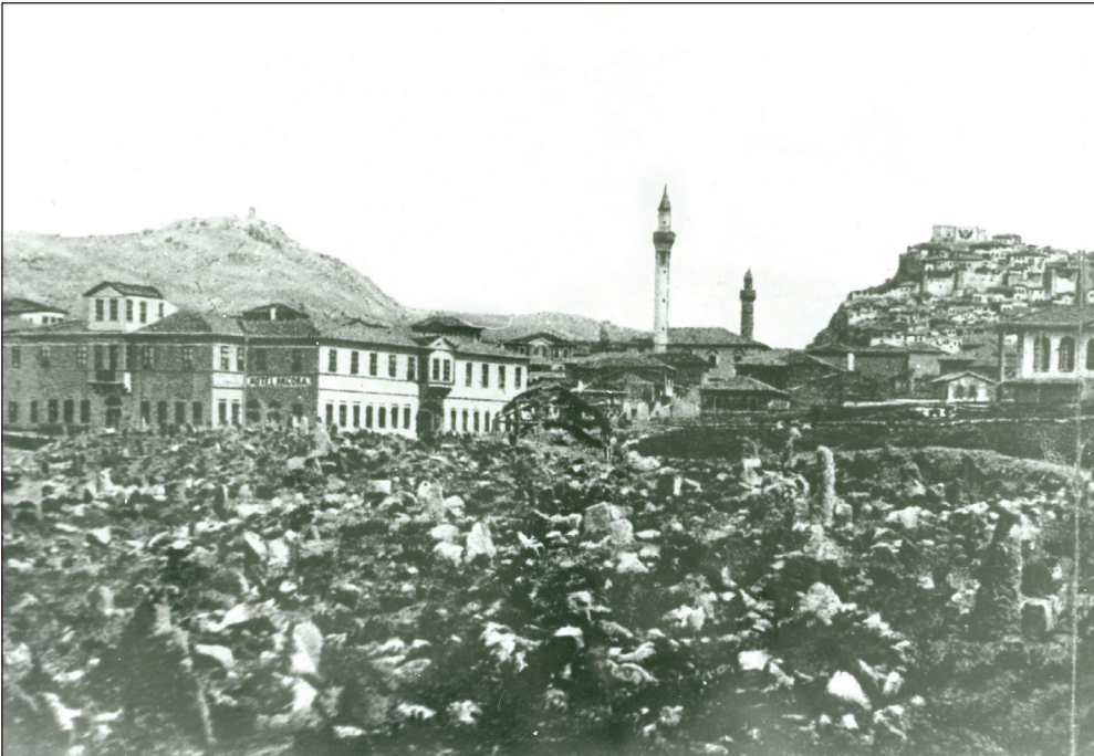
Şekil 8. Düzenleme öncesi Taşhan Meydanı (soldaki yapı Taşhan). Kaynak: Taşhan Meydanı, 1895.

Günümüzün çağdaş koruma anlayışı artık "eski" ve "tarihsellik" kavramlarının dışına çıkarak, her dönemin kentleşme ve mimarlık anlayışını yansıtan özgün örneklerin korunması ve geliştirilmesine yönelmiştir. 2863 Sayılı Kanun'da 5226 Sayılı Kanun ile yapılan değişiklik sonucunda kabul edilen tanım, yeni ve geniş bir perspektif oluşturmaktadır: