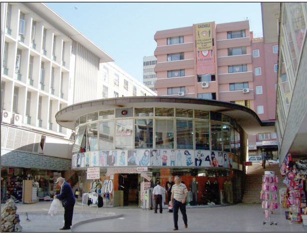
Şekil 4. Ulus İşhanı Kuzey Avlusu (2007).

Ulus İş Hanı, Erken Cumhuriyet Dönemi'nin (1923-1950) ulusal ve uluslararası mimarlık üsluplarından sonra 1950'ler mimarlığının modern çizgisini temsil eden simge yapılardan birisidir (Şekil 4). Bu dönemde giderek artan yeni ticari büro ve alışveriş mekânı gereksinimlerini karşılamak amacıyla inşa edilmiştir. Yapının, üç tarafındaki yolların da yarattığı karmaşık kentsel çevreye karşın, sokaklarla ve Meydan ile kurduğu ilişki, yüksek büro bloğunun hafif gerilimli düzenlenişi gibi özellikleri ona "kentsel yapı" statüsü kazandırmaktadır. Bu özellikleri ile Cumhuriyet Dönemi mimarlık tarihi değerlendirmelerinde önemli bir belge niteliği taşımaktadır. Aynı zamanda binanın yoğun ve aktif kullanımının sağladığı ekonomik değer de göz ardı edilmemelidir.