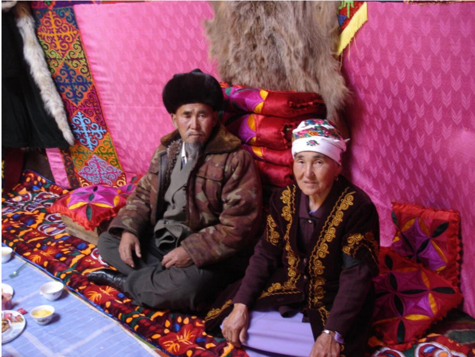
Fotoğraf 8: Kırgızistan-Susamır Bölgesi- Göçmen Çadırından Bir Görüntü

Kırgızistan’ın bayrağında da bugün gördüğümüz motif, İç Oğuz’un kullandığı OĞ damgasıdır. Bu damga günümüzde halen Kırgızistan’daki keçe yapımı çadır evlerin tepe penceresinin formunu teşkil etmektedir.