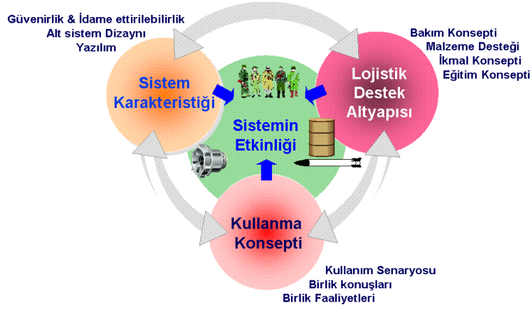
Şekil-2: Silâh Sistemlerin Harekât Etkinliğine Etki Eden Unsurlar

Belirtilen sebeplerle dış tedarik, ülke açısından kritik olan pek çok alanda dışa bağımlılığın da temelini oluşturmaktadır. Oluşacak dışa bağımlılık çeşitleri sadece bu kadarla sınırlı değildir ve sistemsel bazda da kalmayabilir.