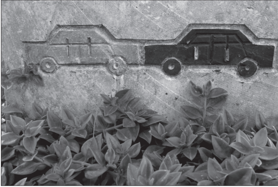
Resim 2: Araba Kazasının Oluşumunu Betimleyen Çizim

Ölüm nedenleri arasında en sık bulgularanan % 2 ile (20 kişi) kazalardır. Bunlar arasında en yaygın olan binek arabalarıyla gerçekleşen kazalardır; bunu kamyon, tır, bisiklet, motosiklet, traktör gibi diğer araçlarla gerçekleşen kazalar takip etmektedir (bkz. Resim 2). Okul, su kuyusu gibi kazaların olduğu mekânlar ya da iki taşıtın çarpışma anının da mezar taşına sembolize edildiği görülebilmektedir.