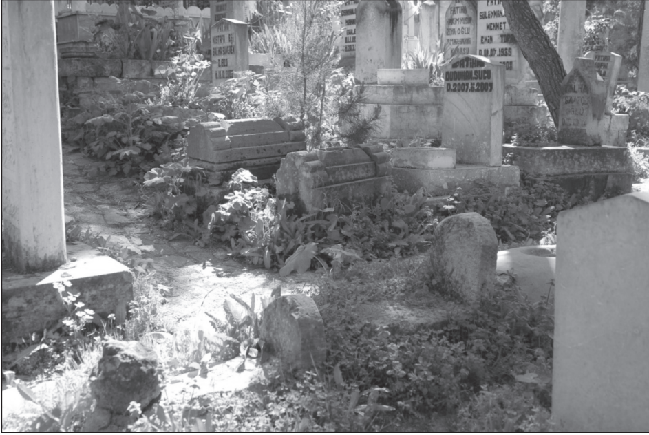
Resim 3: Yetişkin Mezarlarının Arasına Serpiştirilmiş Bebek Mezarları

Şanlıurfa'da çocuklar için farklı bir ölü gömme uygulamasının varlığı kent merkezindeki Harrankapı Mezarlığı ile Harran ve Viranşehir ilçelerinde açık bir şekilde ortaya çıkmaktadır. Harrankapı Mezarlığında bebekler için ayrılmış küçük bir bölüm vardır; aynı şekilde Viranşehir'deki Belediye Mezarlığı ve Yeni Mezarlık'ta bebek ve küçük çocuklar için ayrılmış bir çocuk mezarlığı bölümü bulunmaktadır. Harran ilçesinde ise 6 yaş öncesi çocuklar için ayrılmış iki çocuk mezarlığı bulunmaktadır.