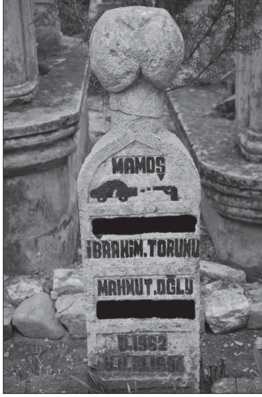
Resim 1a: Bediüzzaman Mezarlığında Silah ve Mermi Çizimi: Şahsın Silahla Öldürüldüğünü Göstermektedir.