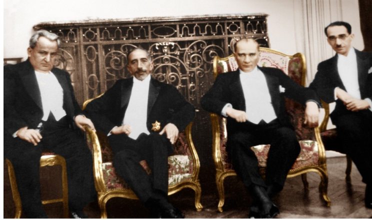
Irak Kralı Faysal'la Ankara Palas (6 Temmuz 1931)