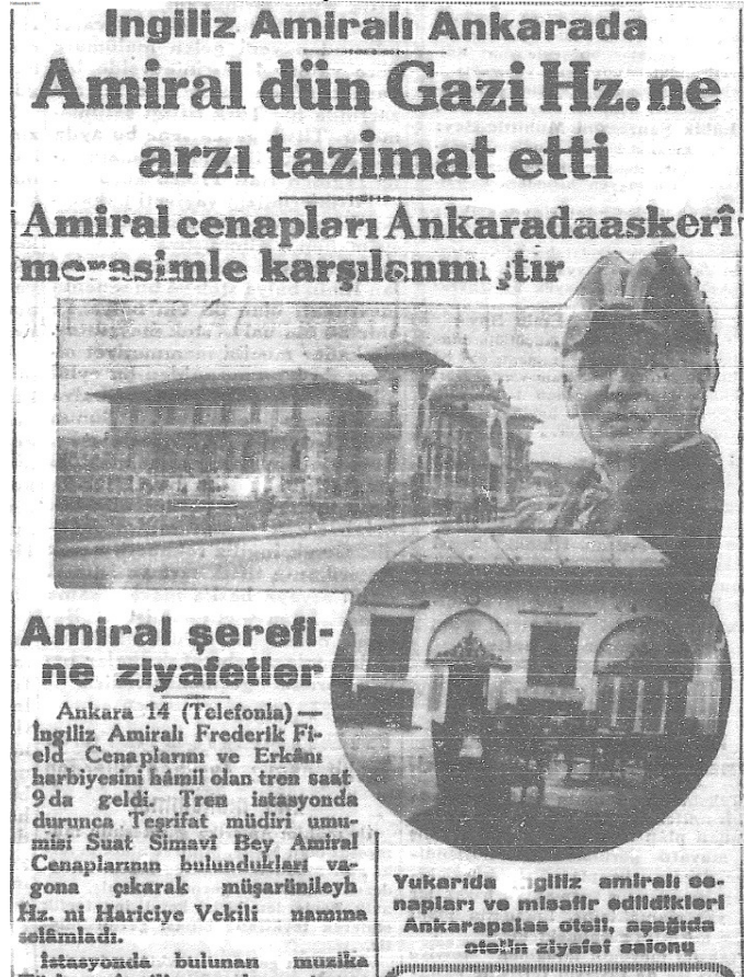
Resim 5. 15 Ekim 1929 Cumhuriyet Gazetesi Ankara Palas Hakkındaki İlk Sayfa Haberi