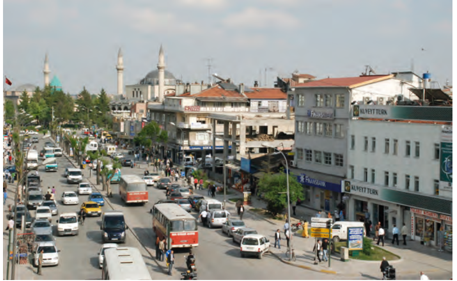
Resim 5. Bağlantı-Koridor Mekânı; Alaaddin-Mevlana Koridoru.

ve Bedesten Bölgesi” içinde ise bedesten düzeni olarak tanımlanan geleneksel çarşı alanı, Aziziye Camisi-Nakiboğlu Han çevresi ile Kapı Camisi-Mecidiye Han çevresi ayrıntıda kentsel tasarım alanları olarak seçilmiştir (Şema 1).