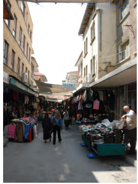
Resim 3. Ekonomik Odak; Hanlar ve Bedesten Bölgesi.

sokak, doku ya da siluet-görünüm düzeyinde özgün karakteristikler eşliğinde biçimlenen mekânsal-işlevsel altyapısının, gerek mekânsal ve sosyal yaşam kalitesinin artırılması gerekse kentsel ekonomik canlanma-kalkınma sağlanmasına yönelik sürdürülebilirlik içerikli stratejiler eşliğinde korunması ve geliştirilmesi açısından önemlidir. Bu stratejiler kapsamında, tarihi kent merkezine yönelik üretilecek sürdürülebilir koruma-geliştirme planının, 'öncelikli planlama alanları' ve 'ayrıntıda kentsel tasarım alanları' olarak programlandırılması (4), sürdürülebilir kentsel korumanın olabilirliği açısından önem taşımaktadır. Bu açıdan, öncelikli planlama alanları ve ayrıntıda kentsel tasarım alanları, Konya tarihi kent merkezinin mekânsal karakteristik ve işlevsel kimlik değerlerinin, sürdürülebilirlik ilkesi temelinde değerlendirilerek, sosyo-mekânsal ve ekonomik canlanma-kalkınma sağlanma açısından kentsel tasarım sürecine aktarıldığı ve test edildiği özel tasarım alanları olarak tanımlanabilir.