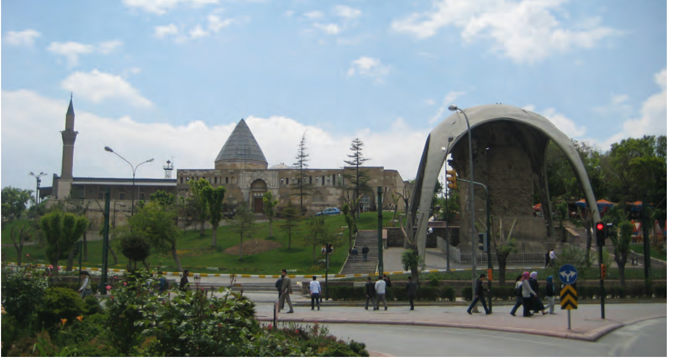
Resim 1. Kentsel Bellek Alanı; Alaaddin Tepesi (Alaaddin Camisi ve Selçuklu Köşkü).

alanlarına yönelik olarak üretilecek tasarım projelerinin, koruma-geliştirme planlarının temel ilke ve stratejileri ile uyumlu olması, bütünlük göstermesi gerektiği unutulmamalıdır.