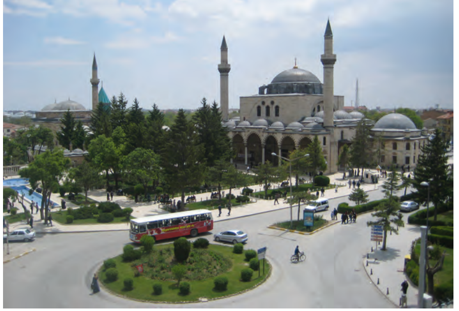
Resim 4. Kültürel Odak; Mevlana Külliyesi (Mevlana Müzesi ve Selimiye Camisi).