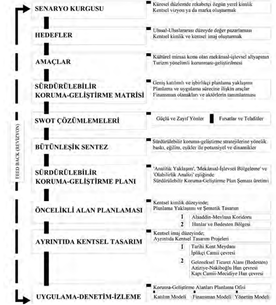
Şema 2. Sürdürülebilir Koruma Geliştirme Planlama Modeli, Konya Tarihi Kent Merkezi.

miras değerlerinden oluşan mekânsal ve işlevsel altyapısının korunması ve geliştirilmesine yönelik planlama sürecinin kavramsal ve hukuksal/kurumsal altyapısının yanısıra uygulama ve denetim sürecinin kapsam ve aşamalarını da belirlemektedir. Bu çerçevede, tarihi kent merkezini ulusal-uluslararası düzlemde rekabetçi yerel kimliğinin geliştirilmesine dayanan senaryo kurgusu kapsamında değerlendirerek, değer pazarlamasına dayanan kültürel turizm ya da kentsel turizm yönelimli hedef ve amaçlar eşliğinde kentsel kimlik oluşumuna yönelik olarak ele alan stratejik mekânsal planlama ve uygulama yöntem izlencesini niteliğindedir (Şema 2).