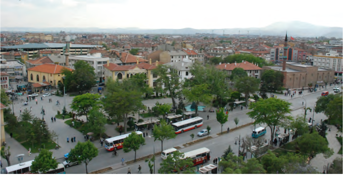
Resim 2. Tarihsel Odak; Tarihi Kent Meydanı.

mekânsal ve işlevsel altyapının ortaya konması, mevcut gelişme eğilim ve olanakları ile geleceğe dönük potansiyel ve dinamiklere ilişkin çözümlerlerin yanısıra, sürdürülebilir kentsel koruma–geliştirme stratejilerine yönelik planlama ve uygulama sürecinin ilkelerinin tanımlanabilmesi açısından da önemlidir. Bu nitelikleri ile sürdürülebilir koruma–geliştirme matrisi, Konya tarihi kent merkezinde sürdürülebilir kentsel koruma planlamasının olabilirliğinin test edilebilmesine yönelik bir planlama aracı olarak kullanılmıştır (Şema 3).